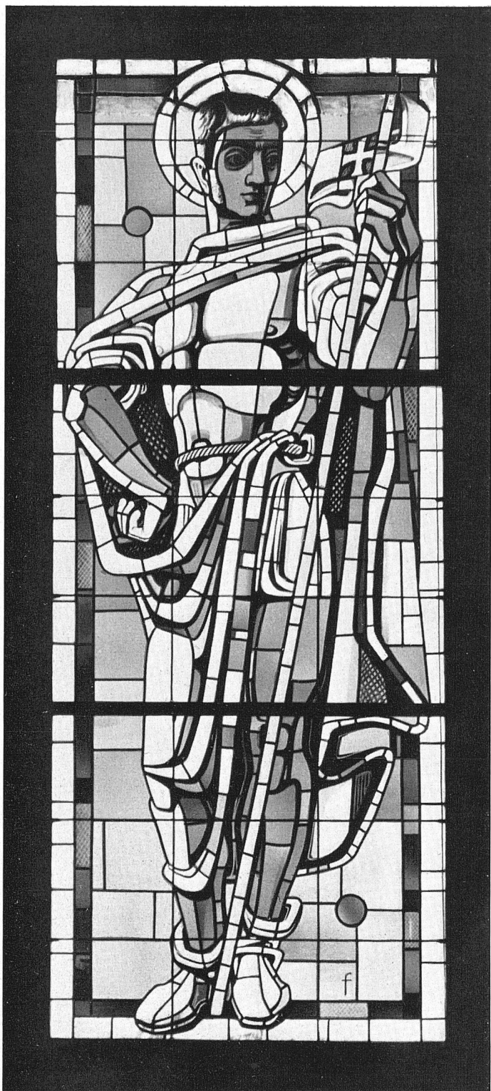
Anton Flüeler Mauritius Kirche Lüttau