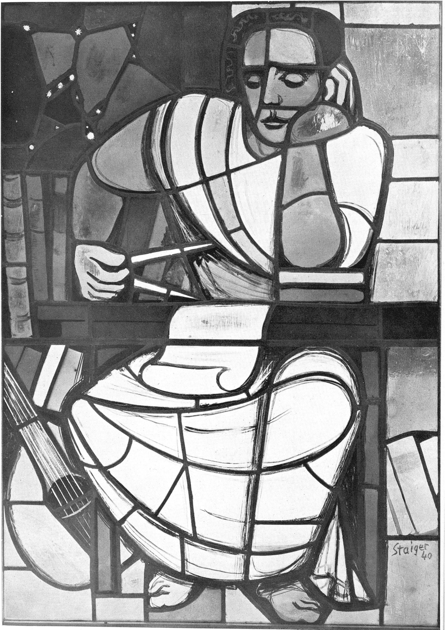
Otto Staiger «Der Denker» Stiftung der Studentenschaft in die Aula des neuen Kollegiengebäudes der Universität Basel