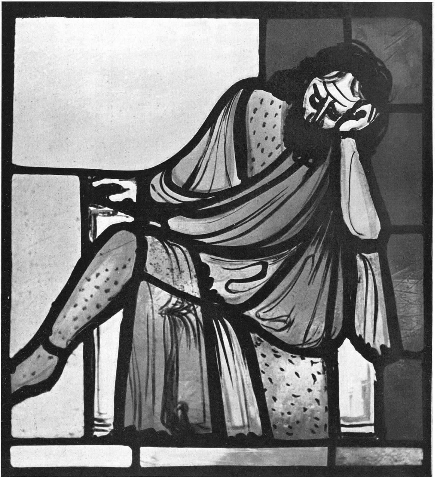
Otto Staiger König David und Saul