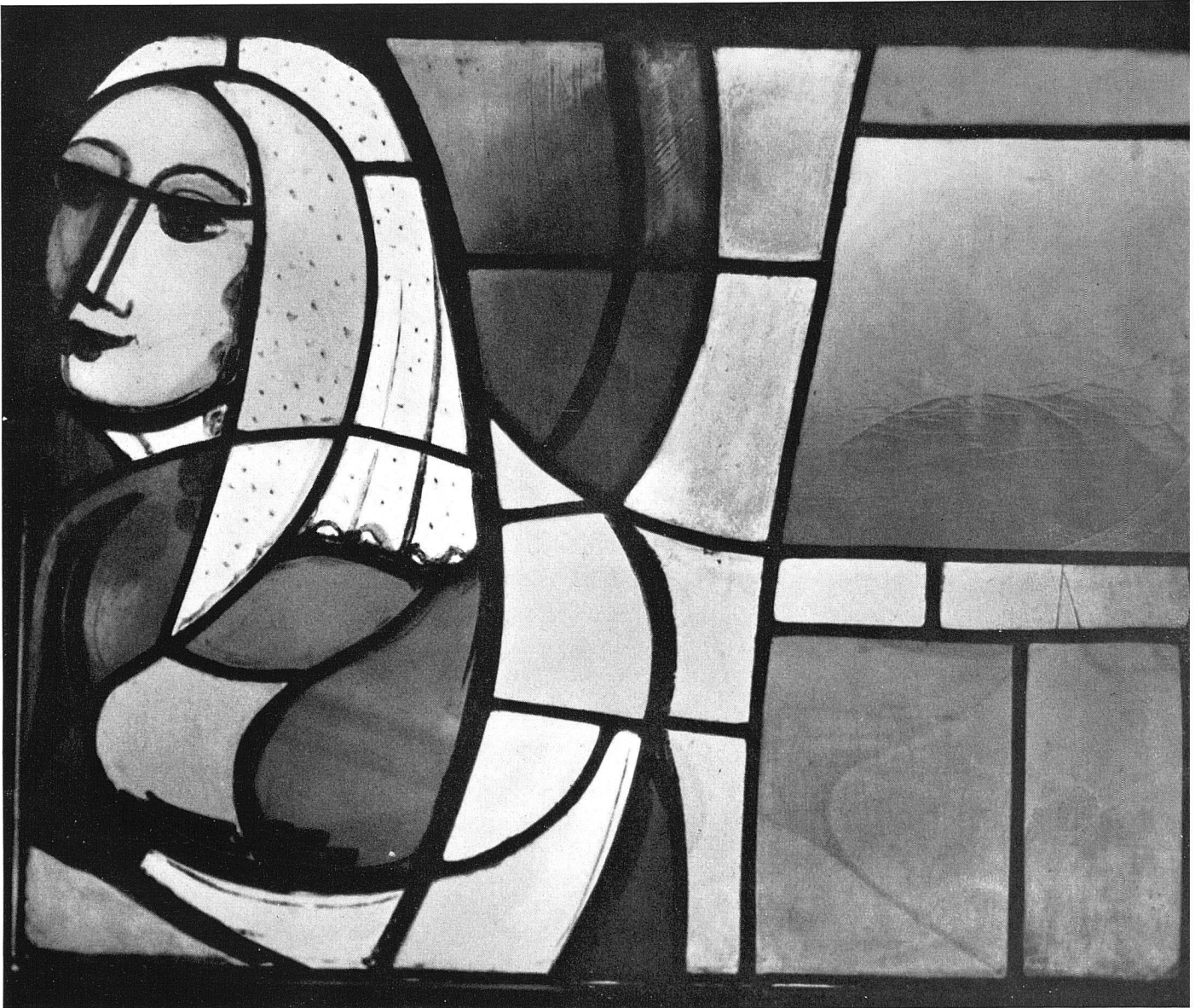
Otto Staiger Glasfenster