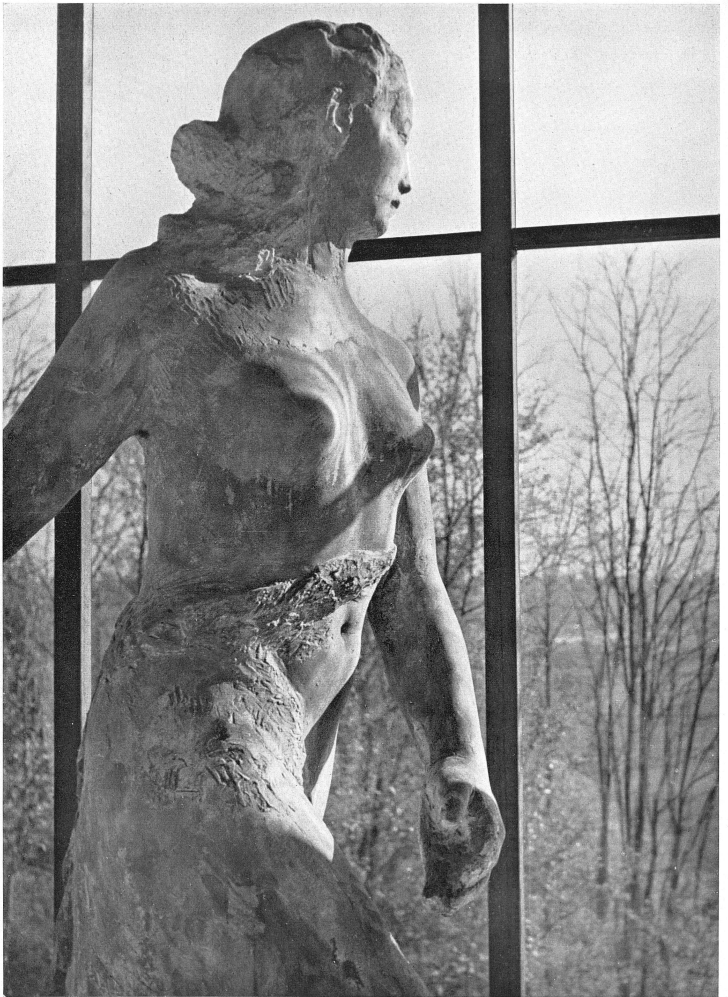
Jakob Probst Säerin Ankauf des Basler Kunstcredits zur Aufstellung im Riehenpark 1935