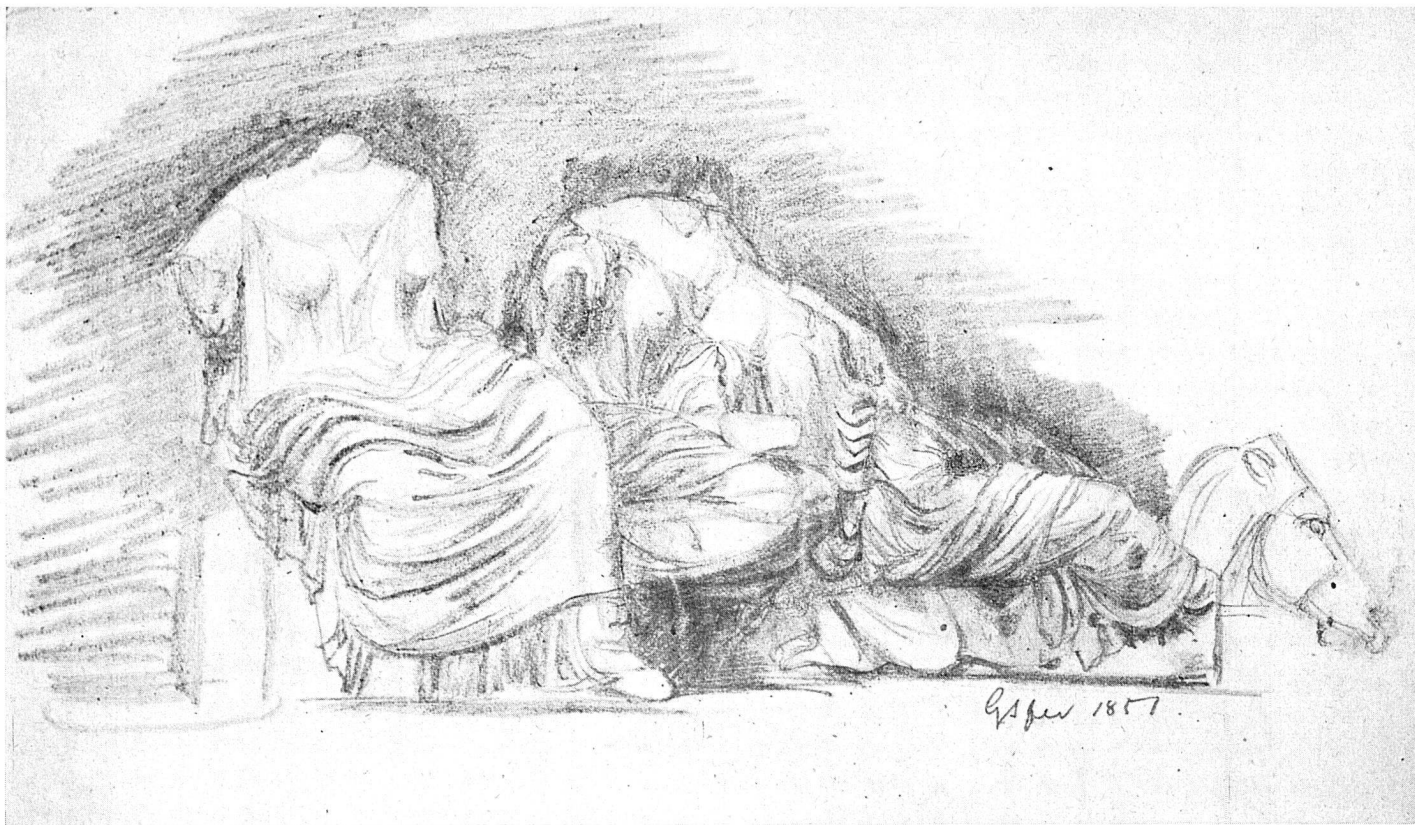
Gottfried Semper 1803–1879