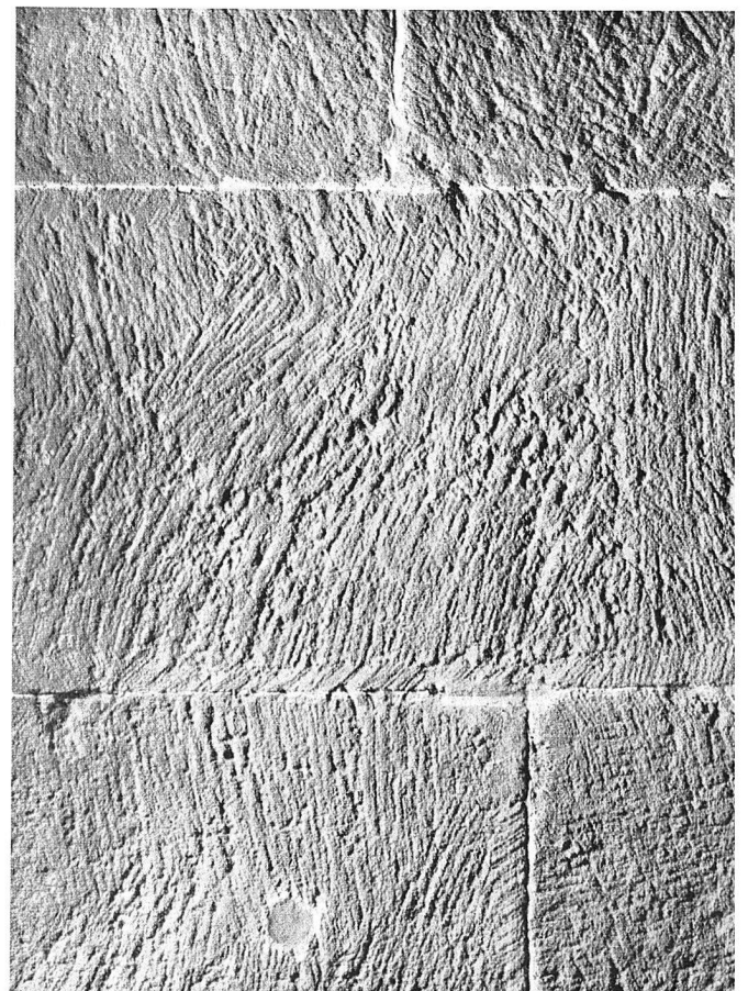
Mit Glattfläche abgearbeitete Quader in der ältern Krypta des Straburger Münsters als Beispiel für romantisches Quaderwerk