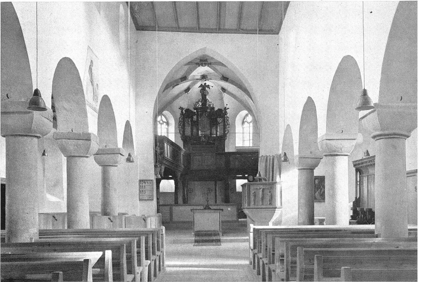
Kirche Oberlenningen Zustand nach der Restauration: neue Holzdecke, frei gelegte romanische Hochwandfenster, Backsteinfußboden, niedere Kanzel elektrische Beleuchtung

das Gegenteil lehrt. Heute sagen wir: Auch hier kann nur von Fall zu Fall geprüft und geurteilt werden. Gewiß ist nicht zu bestreiten, daß stielechte Nachbildungen oft eine Unwahrheit bedeuten; dennoch sind sie nicht unbesehen abzulehnen. Wo z. B. innerhalb eines größeren Zusammenhangs lediglich rein architektonische Einzelformen zu erneuern sind, wird es meist richtig sein, sich der Umgebung anzupassen. Wenn aber ein Gebädetrakt oder größere Teile ganz zu erneuern oder völlig neu herzustellen sind, wird eine Kopie nach alten Vorbildern schon fragwürdig. Sie aber ist unter Umständen trotzdem berechtigt, wo es sich um die Erhaltung eines ganz besonders eigenartigen Bildes handelt. Das kann durch eine Kopie bewerkstelligt werden, wenn die Einzelheiten lediglich baulicher Art sind und ihre technische Durchführung ohne wesentliche künstlerische Einzelformen möglich ist, wie z. B. die Bekrönung eines alten Stadtttores, die vielleicht vor fünfzig bis achtzig Jahren in einer unsachlichen und unkünstlerischen Art umgestaltet wurde und nun im alten Sinn nach altem Vorbild wieder hergestellt wird.