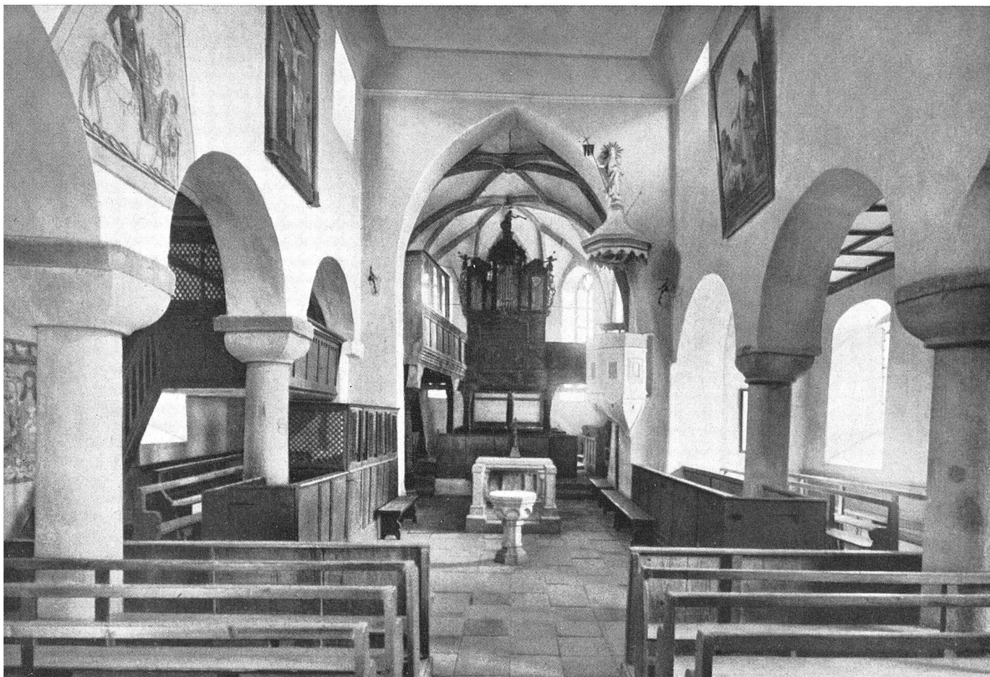
manische Kirche Oberlenningen (Württbg.) aus dem 10./11. Jahrh. Zustand vor der Restauration: Gipsdecke, Hochwandfenster, Kunststeinplatten Abb. aus: St. Martin Oberlenningen, Untersuchungen und Erneuerungsarbeiten, herausgegeben von E. Fiechter, September 1934

nützigkeit, ihm zu dienen. Jedes ist «Ur-kunde», gar nicht etwa nur «Kunstwerk». Es gilt, mit der Denkmalpflegearbeit sich einzufügen, auch unterzuordnen; es soll ja die Würde des Alters , nicht nur die Erscheinung des Werkes erhalten bleiben und mitwirken.