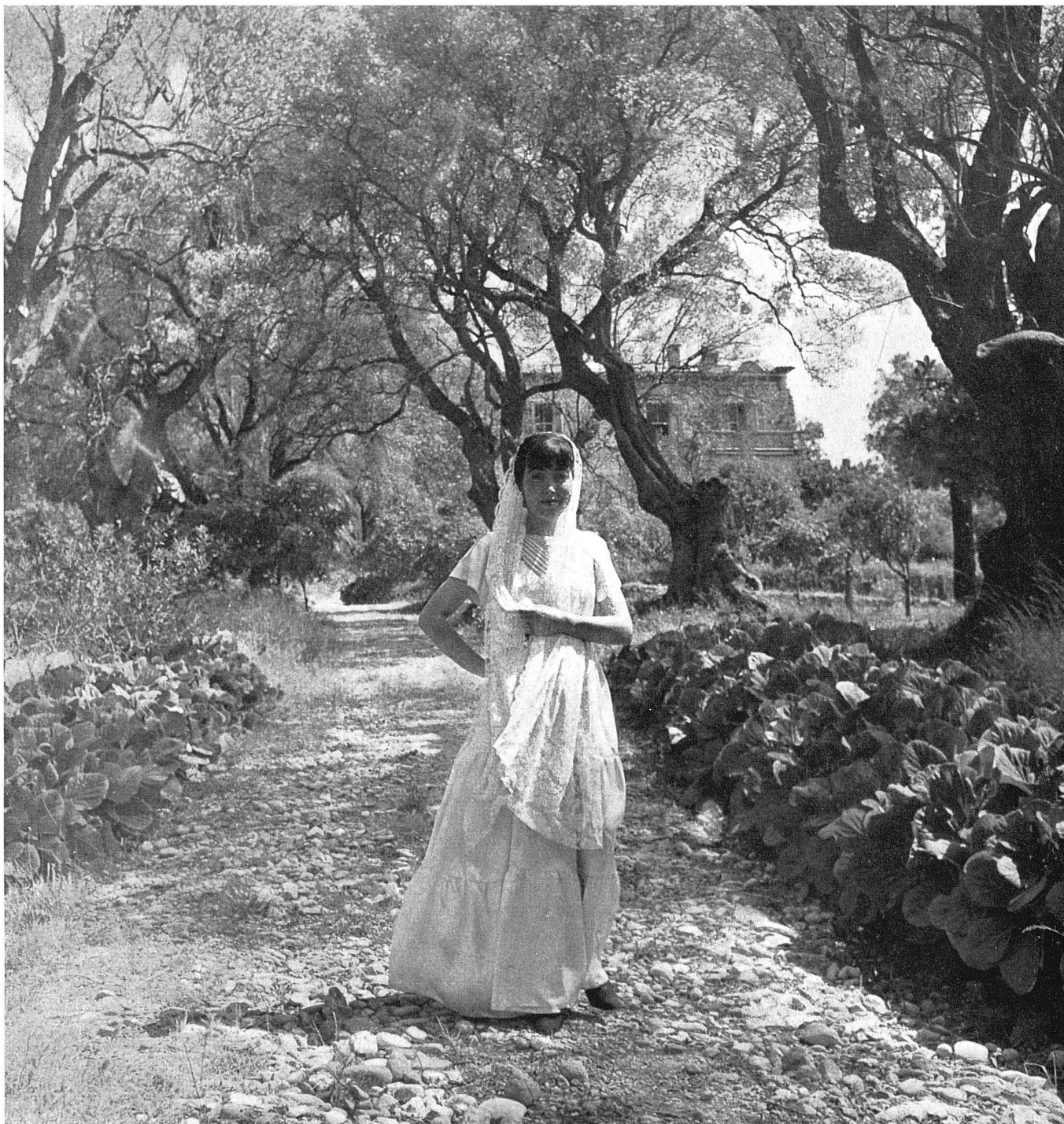
Sous les oliviers du

« Dans ce pays merveilleux, il semble que le malheur ne peut pas vous atteindre », me disait Renoir, « on y vit dans une atmosphère ouatée. »