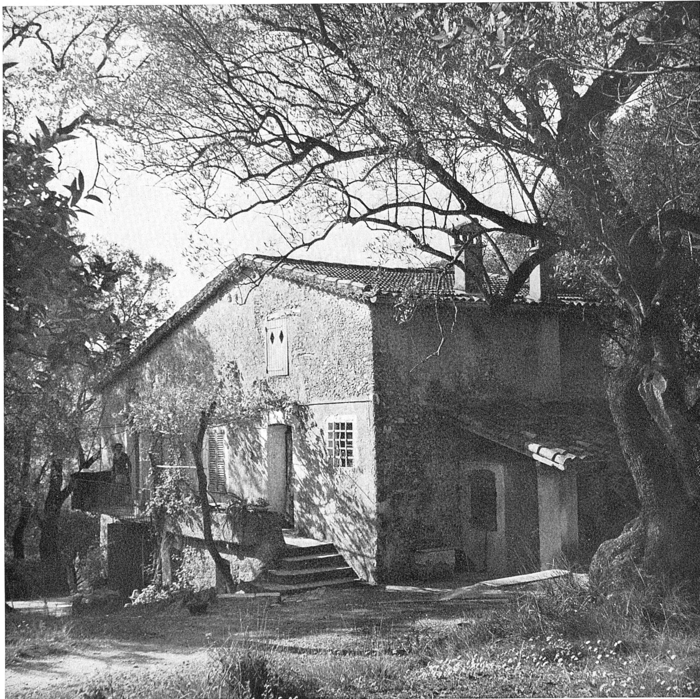
La maison du jardinier