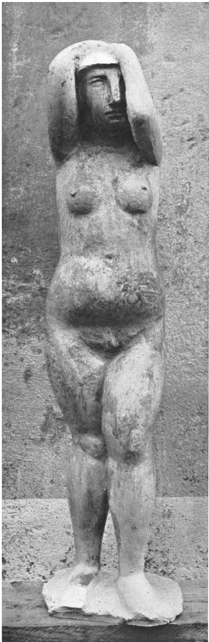
Marino Marini Nudo 1943 Gesso

non poteva esservi rinnovamento se non a mezzo della scultura d'ambiente e cercò di passare, dal frammentario e dall'accidentale dell'impressionismo, ad una sintesi sistematica e definitiva. Ma anche questa posizione fu presto superata, come dimostra quella scultura che Boccioni intitolò Forme uniche della continuità nello spazio .