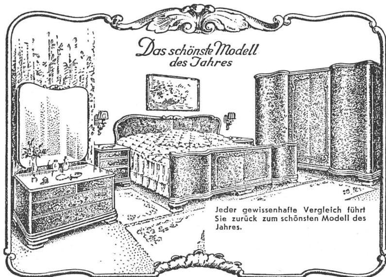
Möbel-Inserat aus einer schweizerischen Tageszeitung

nen». Übergangen wurde die Frage nach einer moralischen Verpflichtung der Schweiz, auch auf diesem Gebiete beim Wiederaufbau Europas mitzuwirken, und nur latent war in dem Diskussionsbeiträge das ästhetische Problem enthalten.