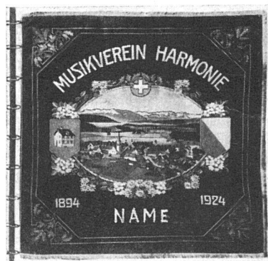
Gegenbeispiel: Vereinsfahne von 1924