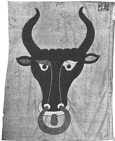
Landesbanner von Uri, 15. Jahrhundert, Rathaus Altorf

Außer diesen offiziellen Fahnen, zu denen auch die alten Zunftfahnen gehören, gibt es aber noch die Vereinsfahnen, die im heutigen Leben und Treiben im Vordergrund unsres Interesses stehen. Man hat es lange fast als Selbstverständlichkeit hingenommen, daß ihre Herstellung mit wenig künstlerischem Geschmack geschah. Wohl aus der unbewußten Erwägung, daß es sich nicht in erster Linie um die Wirkung von weitem handelt, hat man der Vereinsfahne einen mehr sinnlich-beschaulichen Charakter verliehen, oft mit poetischen Zutaten und literarischen Reizen gespickt, die aber meist jede künstlerische Note vermissen ließen. Die Gründung von Sängervereinen, Schützen- und Turnvereinen — etwa vor hundert Jahren — fiel in eine Zeit, die in der Kunst mehr das inhaltliche Motiv schätzte und suchte und auf die Anschaulichkeit der Formen und die Harmonie der Farben nicht allzuviel Gewicht legte: Wappenschilder, Landschaften, umrankt von Alpenrosen und Edelweiß, Lorbeer und Eichenlaub, Darstellungen des Tell, der heiligen Cäcilie, Radfahrer, Schwinger, Trompeter, Sprüche usw. Es war nicht bloß das einzelne Motiv, das kitschig war, sondern die Komposition als solche. Je mehr auf der Fahne stand, umso besser er-