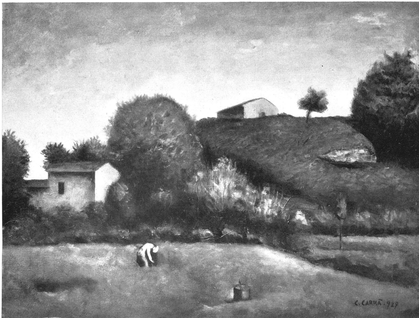
Carlo Carrà Paesaggio 1927

au premier plan, un tréteau emprunté à quelque Marine de Seurat (Seurat et Gauguin, d'une façon ou de l'autre, ont laissé des traces dans la production de Carrà et l'on verra de quelle sorte). Si cette fois le paysage remplace les mannequins, le travail de transfiguration est en substance le même; en d'autres termes, Carrà rend le paysage avec la force de synthèse d'un primitif. On s'aperçoit qu'il a étudié certains fonds des fresques de Giotto à Assise et à Padoue et qu'il en a tiré l'exacte leçon, sans tomber toutefois dans un stylisme dangereux, où l'émotion suscitée par le spectacle de la nature aurait sombré sans remède.