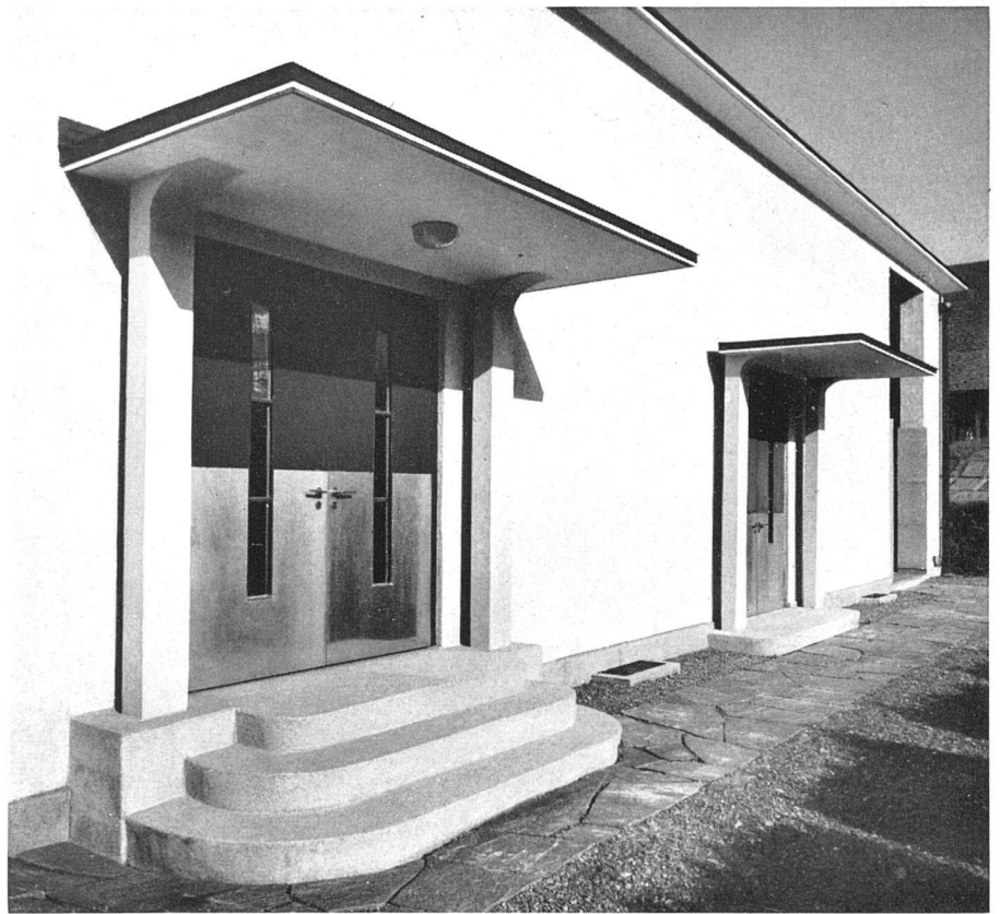
Ausgänge nach dem Friedhof

Erdgeschoß-Bodenplatte Isolierpappen mit Bleieinlagen verlegt.