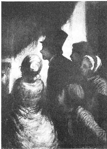
Honoré Daumier, Les Curieux

Es ist aber eine und wohl recht junge Fälschung. Rohe Pinselstriche im Himmel, die scheinbar zwanglose summarische Behandlung der Architektur, die voll Unsicherheiten steckt, die falsche Eleganz, mit der etwa der Zylinder des stehenden Herrn in einem Pinselzuge umrissen wird, die Zerfahrenheit in der Behandlung der Kleider, der mißglückte Kopf der Frau rechts im Bilde machen auf das halb freche, halb gequälte Taster des Nachahmers aufmerksam. Dem Werke des Meisters fremd sind auch die Schwächen der Komposition. Steif und beziehungslos stehen die Personen nebeneinander, und vollkommen abwesend ist jene Energie, mit der die Formen bei Daumier dem Rahmen einbeschrieben sind. Spannungslosigkeit ist überhaupt charakteristisch für dieses Bild: sie ist fühlbar im Anatomischen wie im Gange von Hell und Dunkel, ja sie ist auch der Erzählung eigen. Daumier stellt nicht dramatische Bewegung an sich dar, sondern er macht immer den eindeutigen Grund der Erregung deutlich. In diesem Punkte erscheint die müßige Sinnlosigkeit der Fälschung besonders klar. Die vier Personen, eine Dame, ein Herr im Zylinder, ein junger Ausläufer und eine Frau aus dem Volke, stehen hinter der Brustwehr des Seinequais nahe beisammen und blicken zum anderen