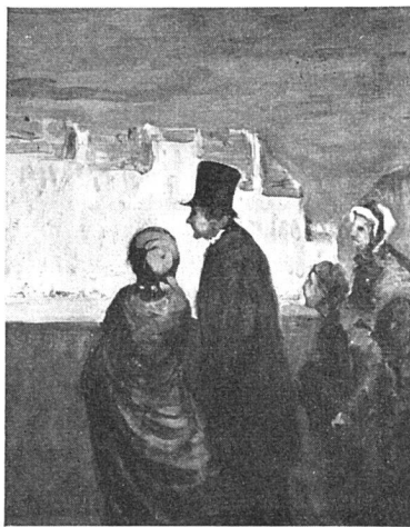
Honoré Daumier, La Laveuse