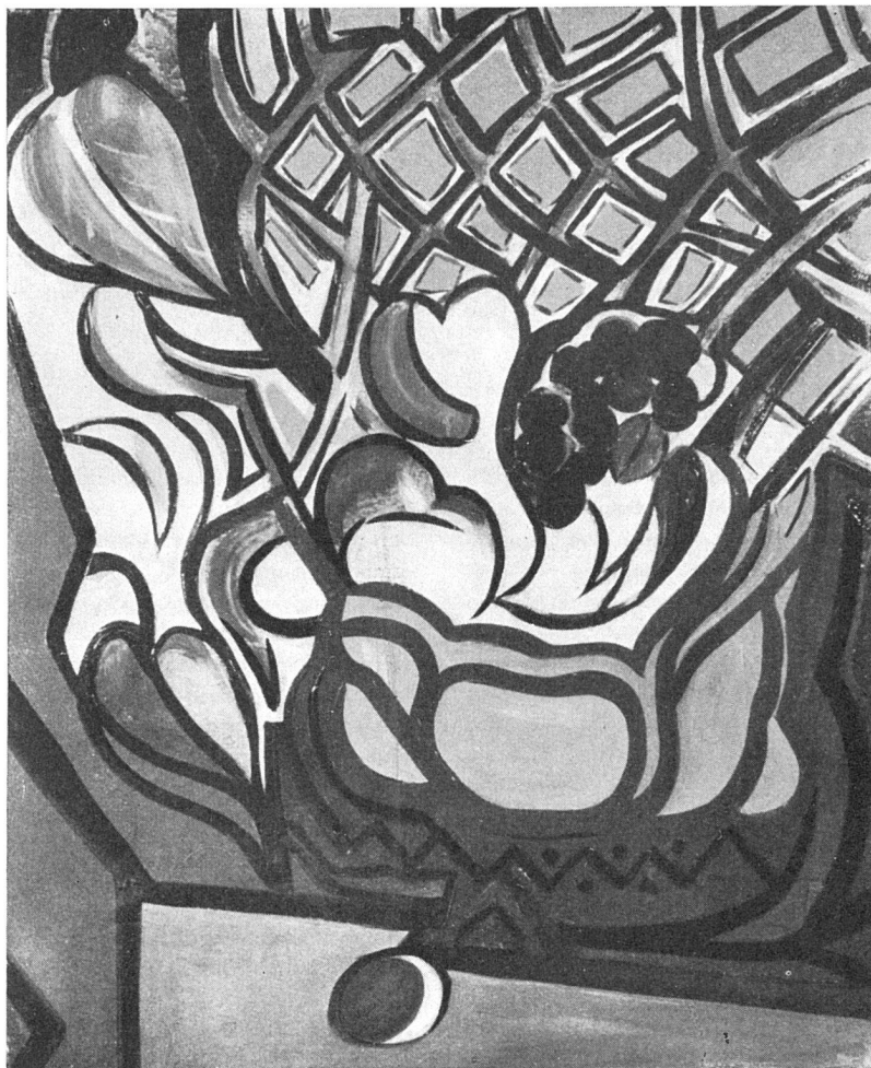
Jacinto Salvado, Stilleben , 1943

eine bescheidene Existenz ermöglichen. Von ihnen sollte die Initiative ausgehen, würdige ausländische Künstler bei uns leben und schaffen zu lassen. Um einer Invasion der Unwürdigen zu steuern, könnte der GSMBA eine Sektion ausländischer Flüchtlinge angegliedert werden, die vor ihrer Aufnahme nach Würdigkeit und Leistung gesiebt würden, wie das auch jetzt schon für die Aufnahme ordentlicher Mitglieder geschieht.