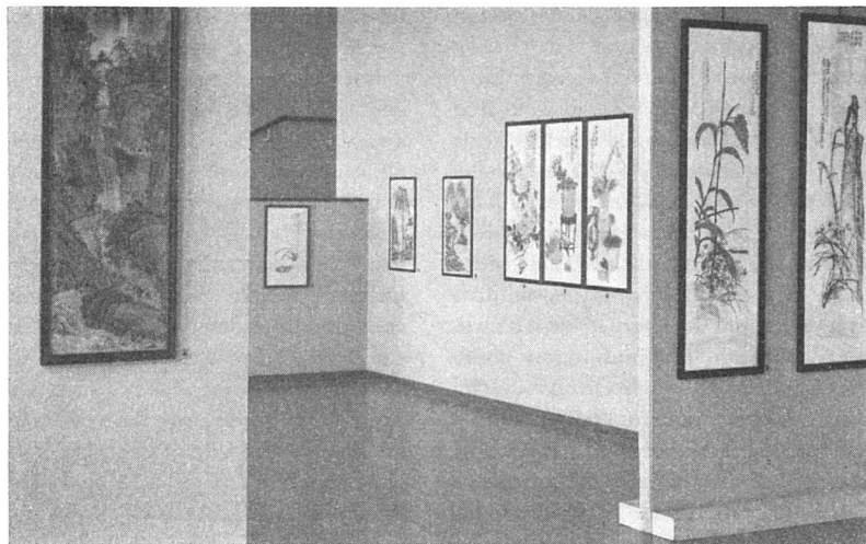
Ausstellung «Chinesische Malerei der Gegenwart» im Kunstmuseum Luzern