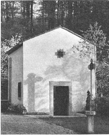
Außenansicht der polnischen Gedenkkapelle