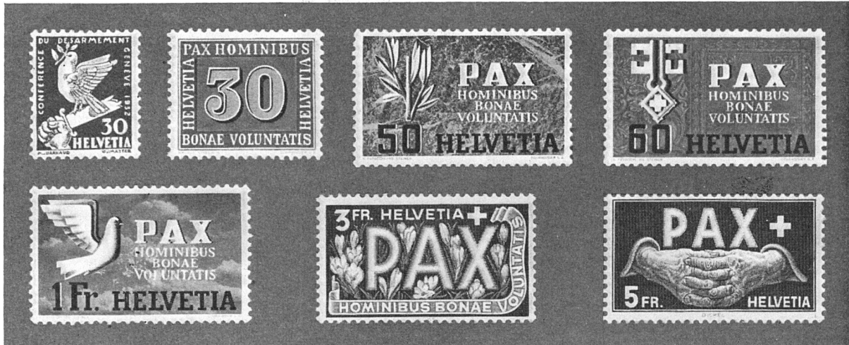
Abrüstungsmarke 1932 und Werte 30 Rp. bis 5 Fr. der Waffenstillstandsmarken 1945