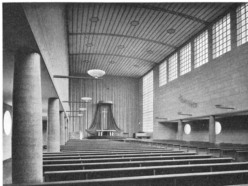
Inneser der Katholischen Kirche St. Joseph in Luzern. Erbaut 1940/41 durch Otto Dreyer, Architekt BSA, Luzern

In den vergangenen Dreißigerjahren war die Bautätigkeit in Luzern keine rege. Um einer Arbeitslosigkeit zu steuern, wurden während mehreren Jahren Notstandsarbeiten, hauptsächlich solche des Tiefbaues, ausgeführt. Mit dem Ausbruch des zweiten Weltkrieges kam die Arbeitslosigkeit nahezu zum Stillstand, dagegen machte sich mehr und mehr ein Mangel an Wohnungen, vor allem in mittlerer und einfacher Preislage, bemerkbar. Einem jährlichen Bevölkerungszuwachs um rund 800 Seelen entspricht das Bedürfnis nach zirka 270 neuen Wohnungen. Nach 1939 nahm die Bautätigkeit rasch ab. Der normale Leerwohnungsbestand von 1,5 bis 2% (200 bis 230 Wohnungen) sank 1942 auf 0,5, 1943 sogar auf 0,26%. Während der Jahre 1935 bis 1939 wurden durchschnittlich etwa 260 Wohnungen erstellt, im Jahre 1940 noch 149 und 1941/42 sogar bloß noch je 122. Um