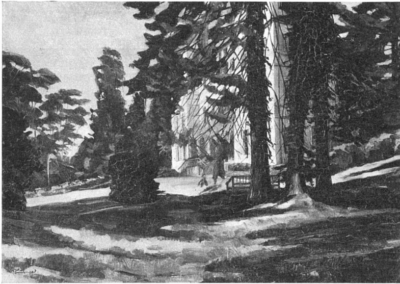
Wilhelm Trübner Schloß Hemsbach