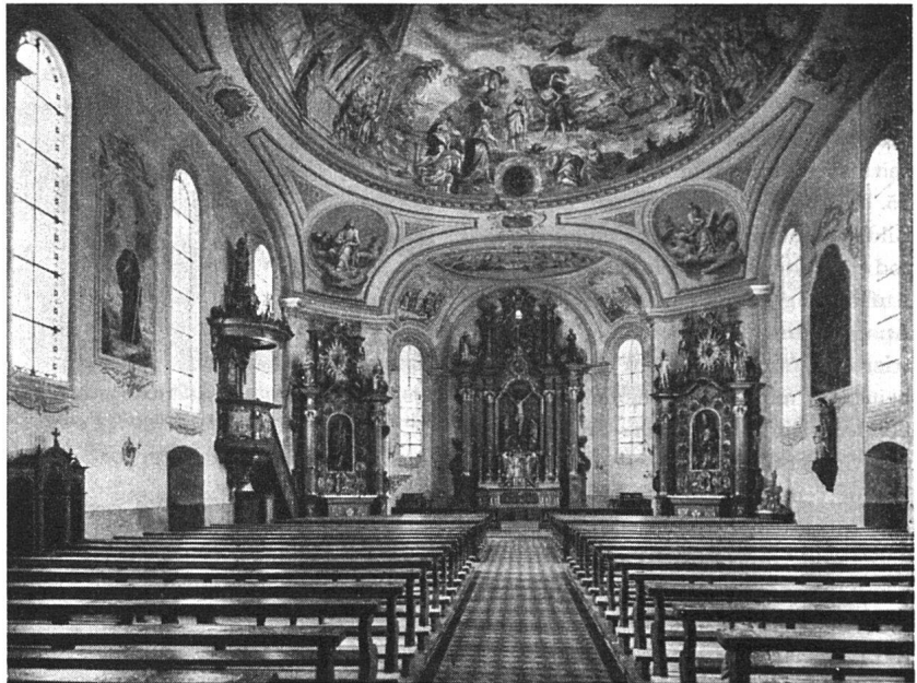
Die katholische Pfarrkirche in Niederhelfenschwil vor der Renovation