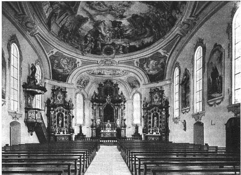
Nach der Renovation von 1942