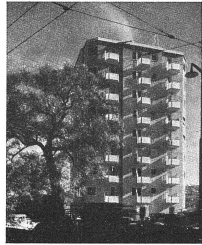
Schwedisches Wohnhochhaus («Punkthaus») in Stockholm. Architekten: Sven Backström und Leif Reinius. Aus «The Architects' Journal» (London), 15. August 1946

Studi . Mailand. Gegründet und redigiert von einer Gruppe der Associazione Libera Studenti Architetti. Verantwortlicher Redaktor: Arturo Morrelli. (neu)