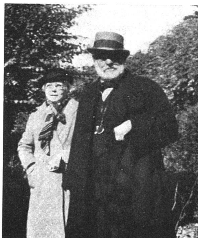
Auguste Perret und Frau in Zürich, 22. Oktober 1946