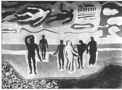
L. Kuhn, Olympisches Gespräch , 1936