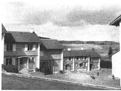
Siedlung Hohliebe in Bern-Bümpliz. Eingangsseite. Architekt: Walter Schwaar BSA Bern

Als erste Bauetappe sind auf der Hohliebe, etwa 15 Minuten außerhalb Bümpliz, 42 Einfamilienhäuser durch den Architekten Walter Schwaar BSA, Bern, erbaut worden. Eine zweite Etappe von 16 ähnlichen Bauten wird voraussichtlich im Laufe des kommenden Winters in Angriff genommen, zugleich mit einem Kindergarten. Die Bauten wurden auf Ende August beendet, nach einer Bauzeit von 7 Monaten. Die 42 Häuser bilden 6 Baublöcke zu 4 Objekten und 6 Baublöcke zu 3 Objekten. 24 Wohnungen haben 4 Zimmer mit EBküche und Bad, 18 Wohnungen haben 5 Zimmer mit gleichem Ausbau. Die reinen Baukosten betragen pro 4-Zimmerhaus Fr. 35 000 und pro 5-Zimmerhaus Fr. 37 000. Die Mietzinse konnten sehr niedrig gehalten werden, einerseits dank ausgiebigen Subventionen (Kanton, Bund und Gemeinde je 15%, mit Amortisationen), andererseits dank einem genauen Studium aller einzelnen Positionen und Baudetails. Sie betragen Fr. 102.- für das Vierzimmerhaus und Fr. 105.- für das Fünfzimmerhaus. Die Häuser werden nur an Familien mit Kindern abgegeben; die Grundrisse nehmen darauf Rück-