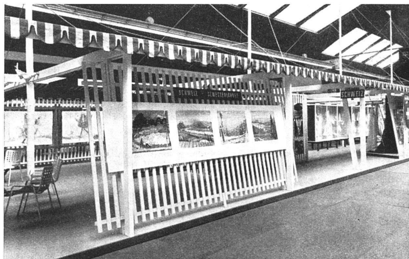
Schweizer Abteilung an der Internationalen St. Erikmesse in Stockholm, 24. August bis 2. September 1946. Da die Schweiz den Mittelteil der Königlichen Tennishalle zur Verfügung hatte, deren Boden nicht verletzt werden durfte, wurde eine leichte Konstruktion gewählt, die in zwei Tagen montiert war. Architekt: A. Dürig in Firma Bräuning, Leu Dürig, Arch. BSA, Basel

Eine gut geschriebene mit guten Beispielen und ebensolchen Abbildungen belegte Schrift von knapp 20 Textseiten, wie sie von Zeit zu Zeit, vielleicht alle 20 Jahre, in jeder bedeutenden Ortschaft unsres Landes erscheinen sollte, nicht um die sogenannten «Leute des Fortschritts» zu bekehren oder zum Verschwinden zu bringen – denn das ist vergebliche Liebesmühe, es wird immer wieder «heillose Dummköpfe» (Hodler) geben –, sondern um dokumentarisch die Etappen einer ebenso trostlosen wie sichern Verschandelung unsrer Städte wenigstens der Nachwelt zu überliefern. Stettlers Schrift ist zwar optimistischer gehalten. Seine Berner Beispiele sollen die Augen öffnen, und zudem verwahrt er sich grundsätzlich gegen eine Mumifizierung alter Überlieferung. Aber im Grunde wird jeder Eingriff in das alte Stadtbild auch in Zukunft zu Enttäuschungen, im besten Fall zu kläglichen Kompromissen führen, die man dem auf Charakter und innere Wahrfähigkeit haltenden modernen Architekten nicht zumuten möchte. Am meisten Berechtigung wird man den Wiedergutmachungen alter Sünden – es ist peinlich genug das einzugestehen – und dann den wohl nicht zu umgehenden Altstadtanierungen zuerkennen, die heute in unsern Städten mit viel Feingefühl und Hygiene ohne Verletzung des äußeren Aspektes durchgeführt werden. Man wird diese letzteren schon deshalb begrüßen müssen, weil sie gerade eine gewisse Garantie zur Erhaltung des Stadtbildes sind. Im übrigen wird man aber der schon des öfters in verschiedenen Varianten