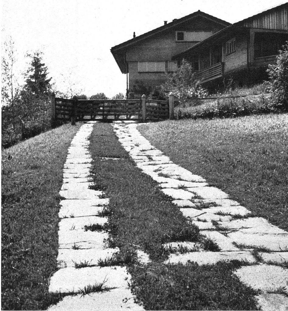
Der leicht ansteigende Zugangsweg aus Granitplatten ist als Autospur angelegt