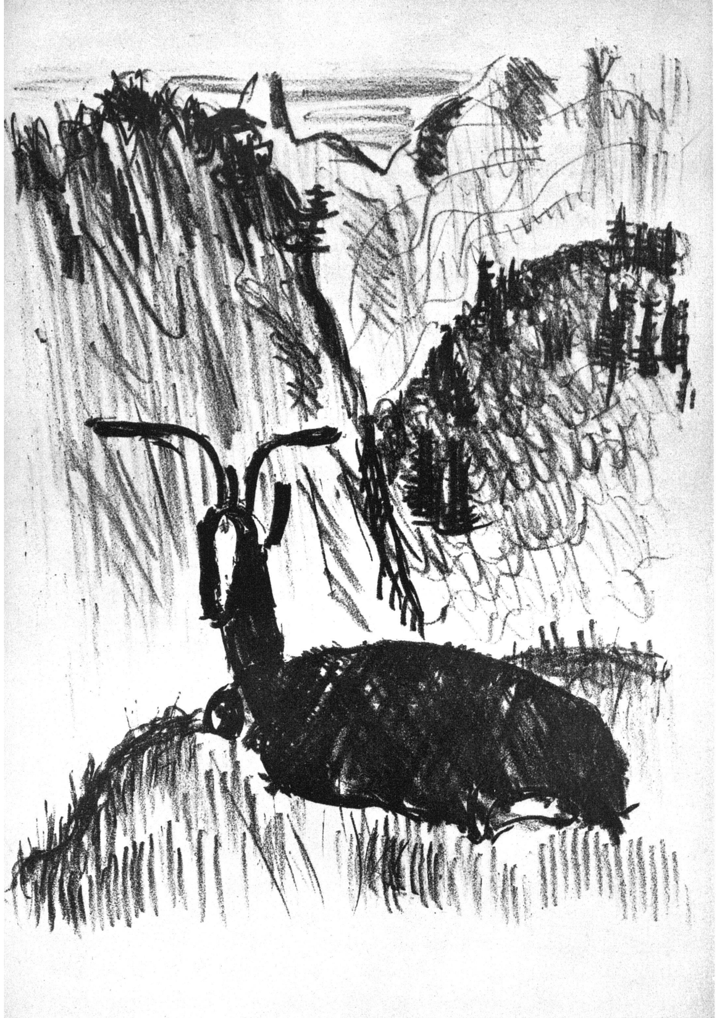
Illustration von Hans Berger zu «La grande peur dans la montagne» Lithographie