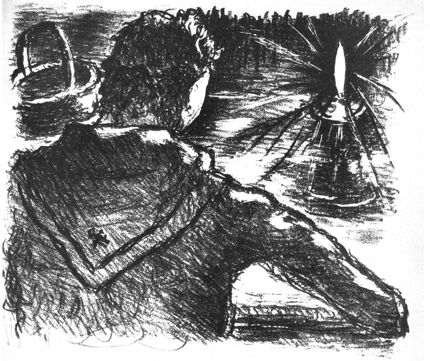
Hans Berger Illustration zu «La grande peur dans la montagne» Lithographie