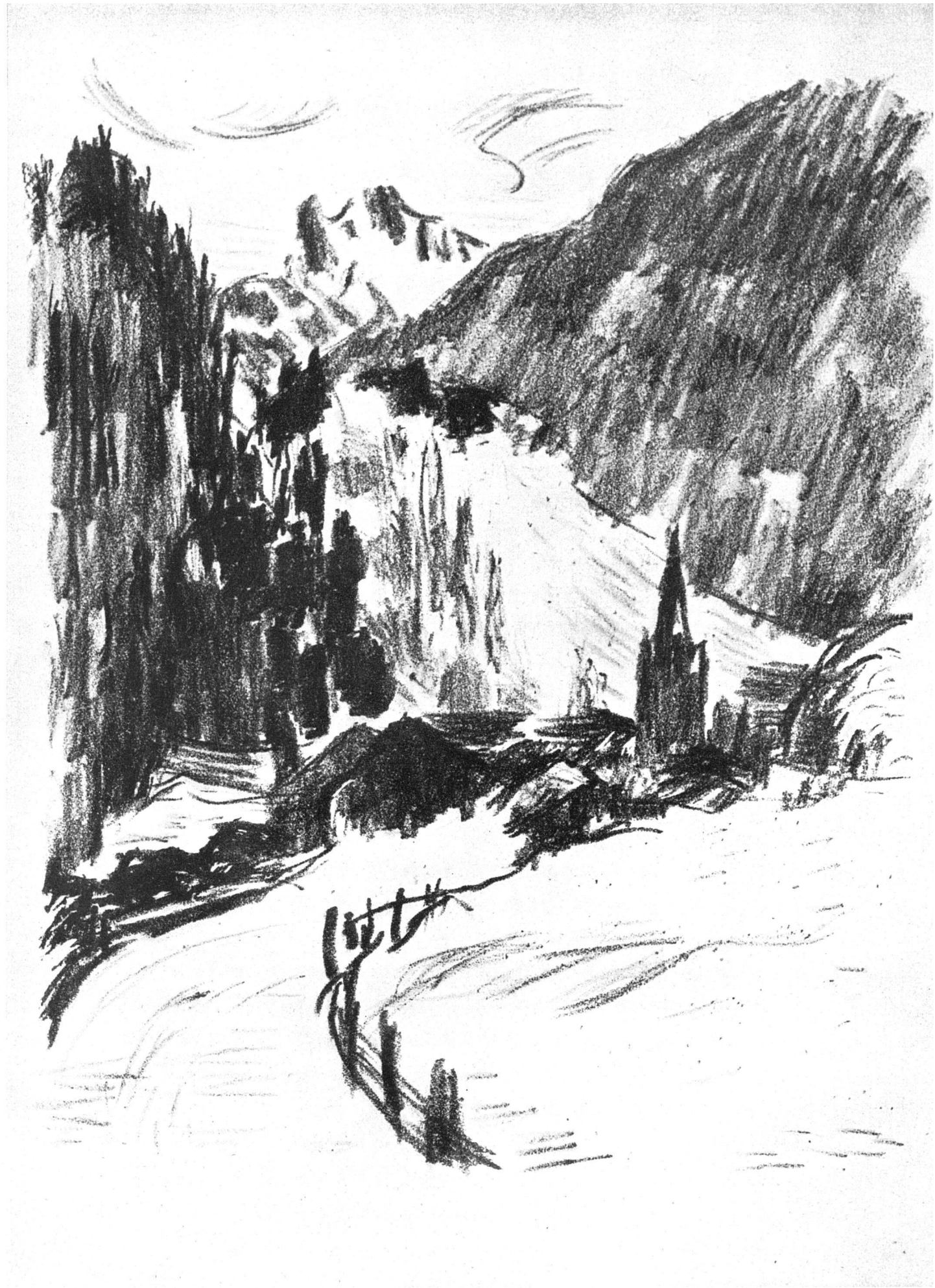
Illustration von Hans Berger zu «La grande peur dans la montagne» Lithographie