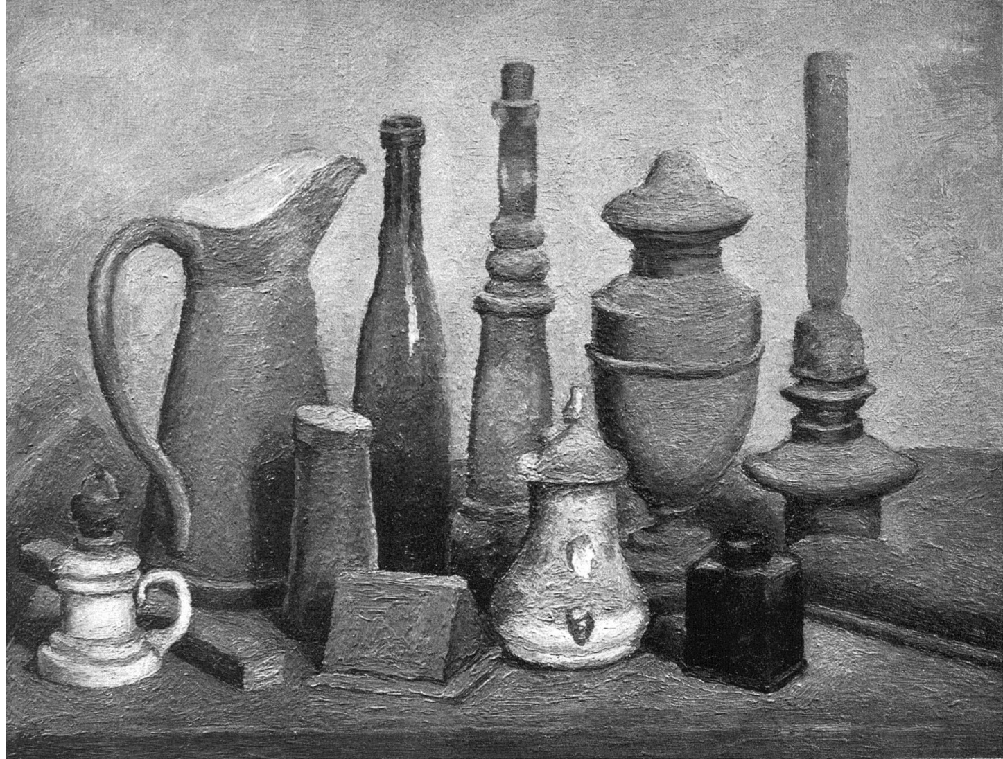
Giorgio Morandi Nature morte 1929

lièrement des essais de ses camarades plus âgés. Un Paysage de 1911, son premier tableau connu, nous montre déjà un artiste accompli, sans tâtonnements, et en possession d'un langage destiné à s'affiner jusqu'aux extrêmes limites, mais non à changer. C'est un paysage conçu par grandes masses : deux lignes dominantes, l'une horizontale – celle de l'horizon –, l'autre oblique, celle de la pente d'un coteau, équilibrée par les verticales de maisons parmi des arbres. La tonalité générale est très délicate, d'un vert tendant au gris, et le rapport entre les deux bandes du terrain et du ciel est trouvé d'emblée; autrement dit, il n'y a là aucune trace de cet impressionisme hybride si répandu à l'époque dans les ateliers allemands et italiens, tandis que s'affirment au contraire un évident souci de composition répondant à des règles architecturales, et un très exact sens des valeurs. Syntaxe qui n'est pas pourtant une fin en elle-même; le jeune Morandi révèle déjà son don de la transfiguration poétique du sujet – d'une magie s'exprimant par un langage fait d'allusions discrètes. Ce premier