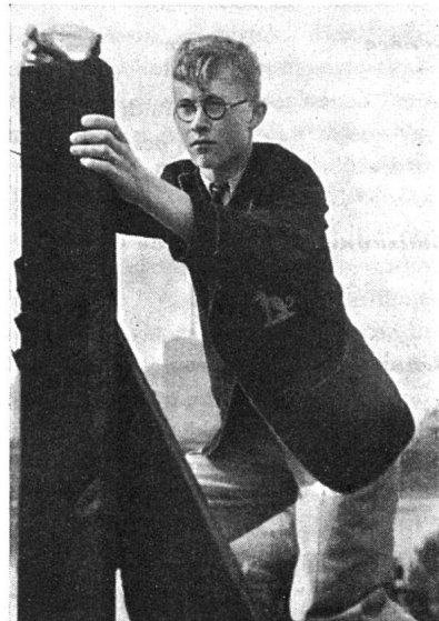
Schüler von Middlesbrough bei Bestimmung der Luftverunreinigung

und ihre Schulwege eingetragen sind. Eine ähnliche Aufgabe haben die Mädchen gelöst. Sie besorgten die entsprechenden Erhebungen über Geburten und Todesfälle, über die Verteilung der Ladengeschäfte und der Heime der verschiedenen Clubmitglieder und ihrer Clublokale. Auf diese Art helfen die künftigen Bürger Middlesbrough's mit, ihrer Stadt ein neues Gesicht zu schaffen.