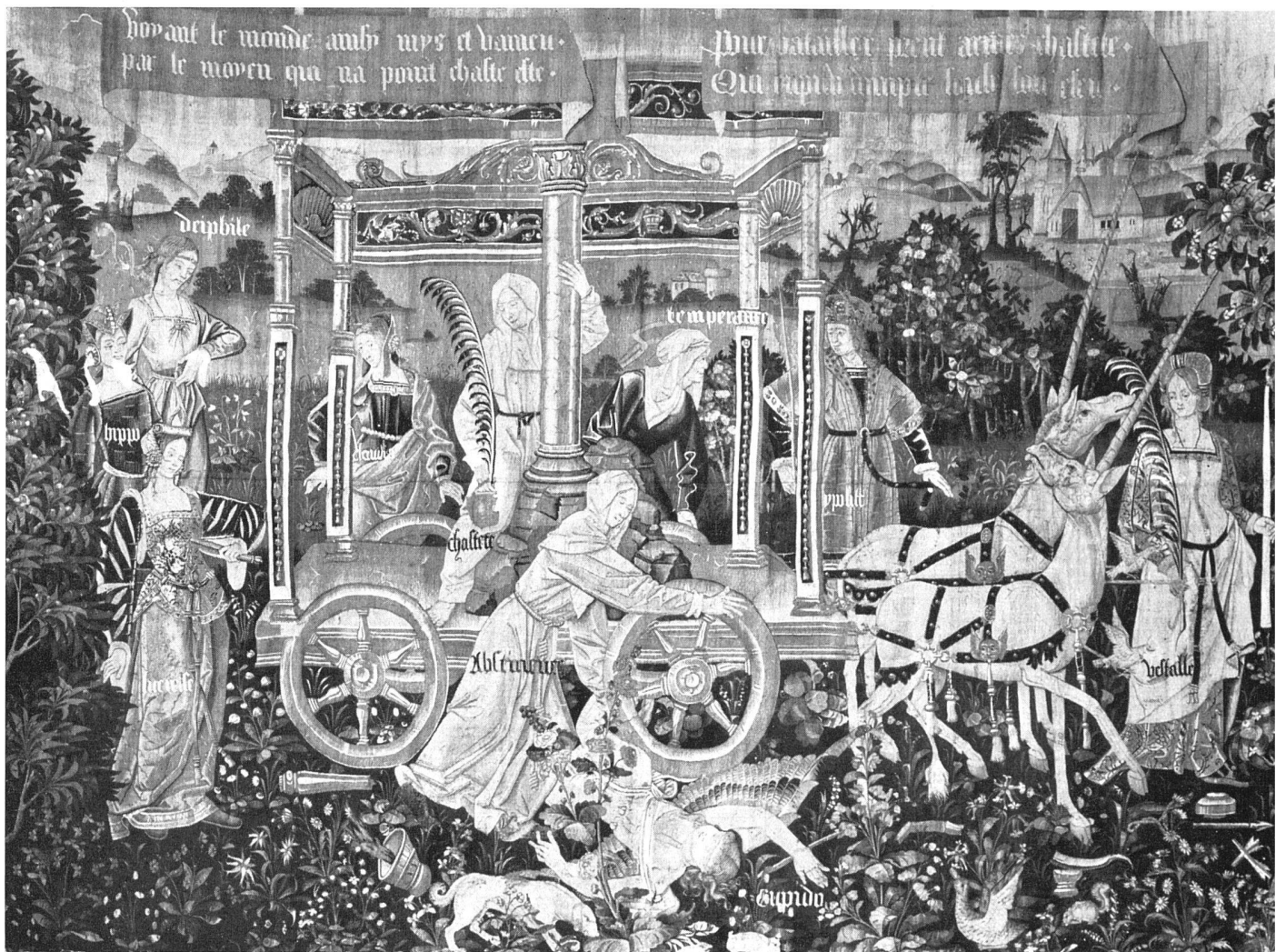
Abb. 4 Der Triumph der Keuschheit über die Liebe. Nordfranzösischer Wirkteppich, Anfang 16. Jahrhundert. Wien, Kunsthistorisches Museum / La Triomphe de la Chasteté. Tapisserie, Touraine, début de 16 e siècle / The Triumph of Chastity over Love. Tapestry of northern France. Early 16th century.

Entwurf eines niederländischen Renaissancemalers aus der Nähe des Quentin Massys ausgeführt. Auf ihn weisen die sanfte gedämpfte Stimmung, die schön ausgewogene Komposition, die Gelassenheit, die Zeichnung der schmalen ovalen Gesichtstypen, die Musterrung des Moiréegewandes vom Joseph von Arimathia. Die leider verblaßten Farben sind fein gegeneinander abgewogen mit der roten Außen- und Mittelfigur und den blauen dazwischen. Gold ist diskret zur Aufhellung, Seide zur Schattierung benutzt. Hier tritt uns zum ersten Male auf der Ausstellung der Teppich als «Bild» entgegen – er ist von der Umwelt abgesondert durch eine schmale rote Bandborte mit Blumen und Trauben. Wie dieser Rahmen immer breiter, schwerer und gewichtiger wird, das läßt sich trefflich an den ausgestellten Gobelins beobachten (Abb. 3).