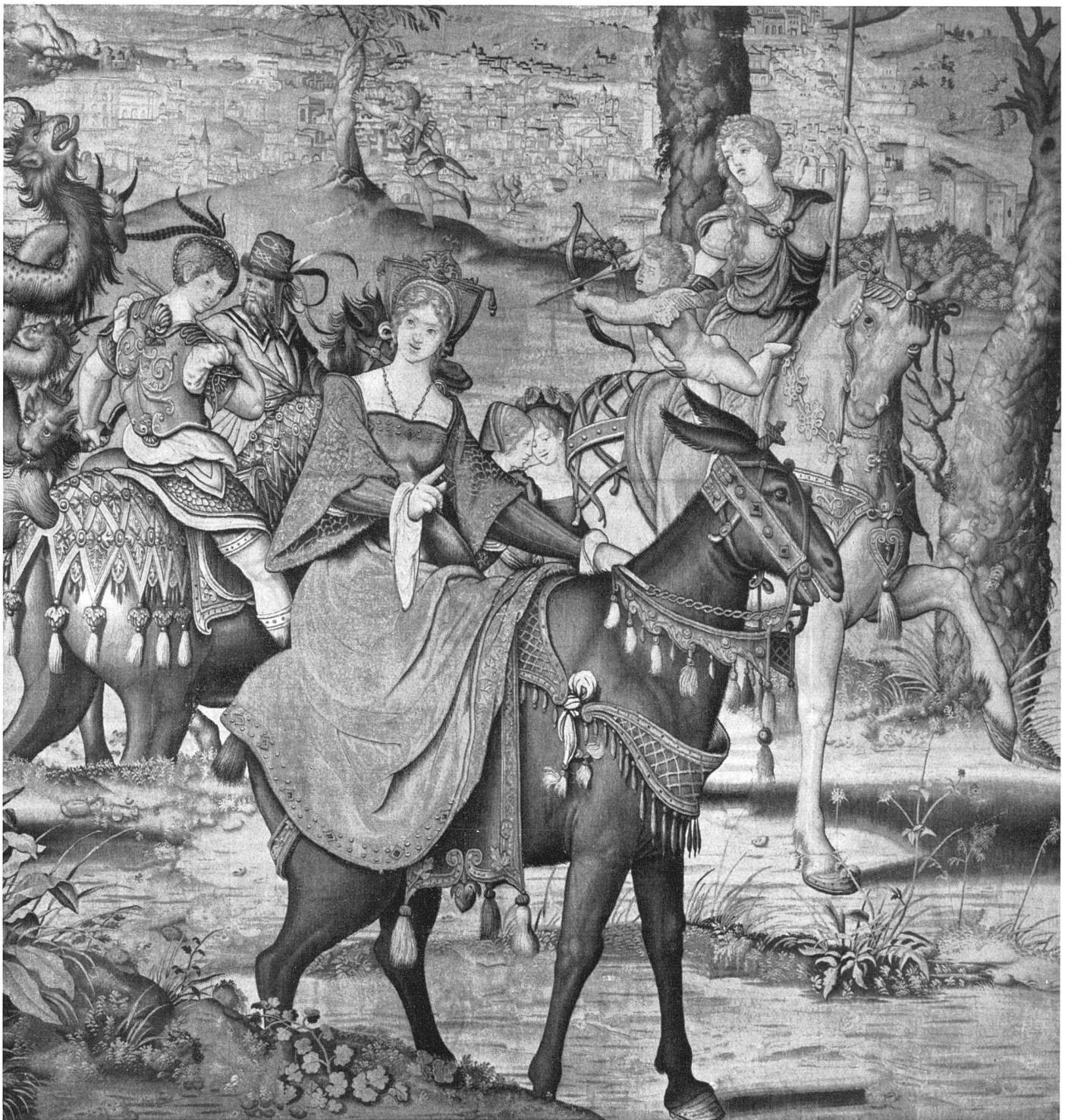
Abb. 6 Die Unzucht. Brüsseler Wirkteppich von Willem Pannemaker, Mitte des 16. Jahrhunderts. Wien, Kunsthistorisches Museum. Detail / La Luxure. Tapissérie, Bruxelles, 2 e quart du 16 e siècle. Détail / Lechery. Brussels tapestry by Willem Pannemaker, 2nd quarter of 16th century. Detail

Es bleibt als letzter Triumphator die Ewigkeit, dargestellt als die Dreieinigkeit in der Glorie auf dem Wagen, der nun alle Triumphatoren überfährt. Die ausgestellten Teppiche zeigen den Triumph der Keuschheit und des Todes (Abb. 4 und 5).