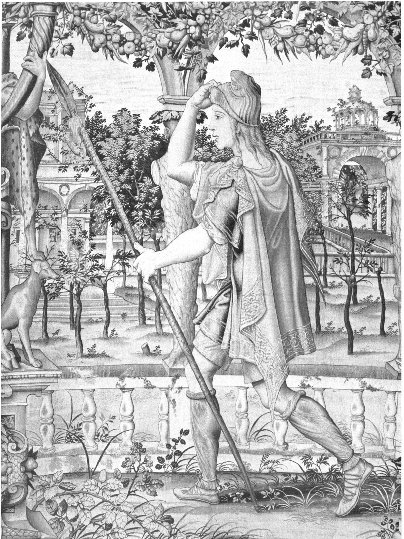
Abb. 7 Vertumnus naht Pomona als Landmann. Brüsseler Tapissérie, Mitte 16. Jahrhundert. Wien, Kunsthistorisches Museum. Detail | Vertumne déguisé en paysan. Tapissérie, Bruxelles, milieu du 16 e siècle. Détail | Vertumnus approaches Pomona as a rustic. Brussels tapestry. Middle 16th century. Detail