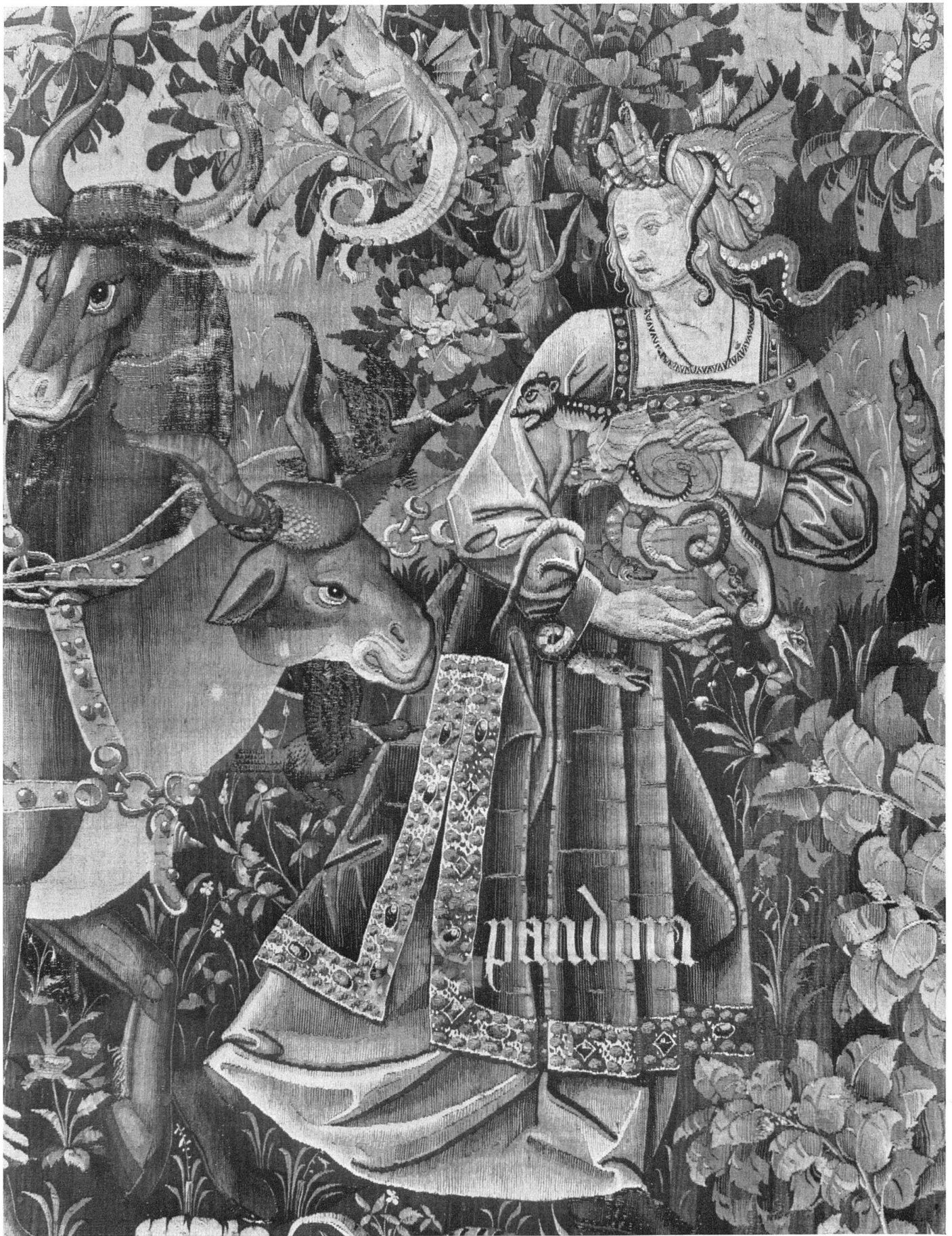
Abb. 5 Der Triumph des Todes über die Keuschheit. Nordfranzösischer Wirkteppich, Anfang 16. Jahrhundert. Wien, Kunsthistorisches Museum. Detail | Le Triomphe de la Mort. Tapiserie, Touraine, début du 16 e siècle | Death's Triumph over Chastity. Tapestry of northern France. Early 16th century. Detail