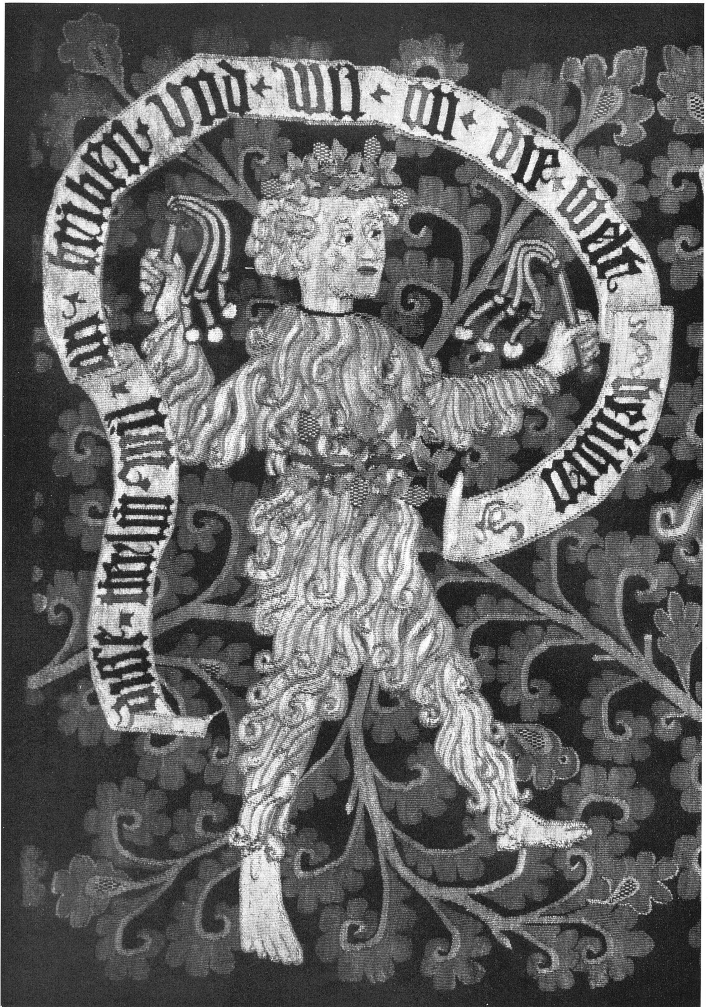
Abb. 2 Schweizerischer Wirkteppich mit wilden Leuten und Fabeltieren, Detail / Homme sauvage. Tapissérie suisse, milieu du 15 e siècle. Détail / Swiss tapestry with bogey-men and legendary animals. Middle 15th century. Detail