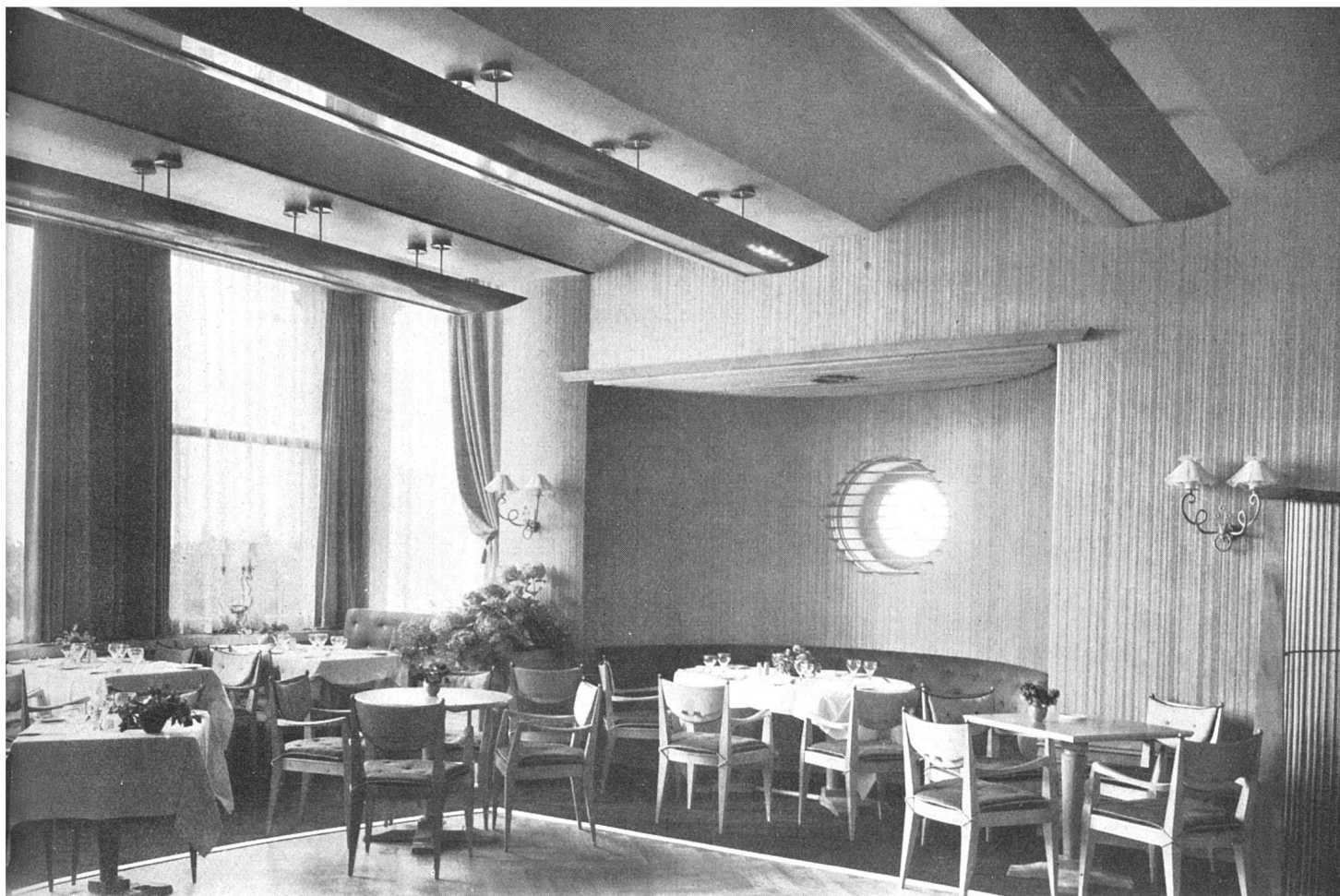
Grill-Restaurant, neue Möblierung in hellem Holz mit hellblauen Stoffbezügen / Le grill restaurant; nouveaux meubles en bois clair, tendus de tissu bleu clair / Grill-restaurant with new furniture of clear wood and pale blue material