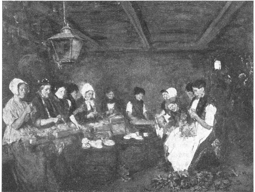
Max Liebermann, Konservenmacherinnen , 1873. 1. Fassung. Privatbesitz Winterthur. Aus der Ausstellung im Kunstmuseum St. Gallen

Liebermann ist auch einer der größten Zeichner. Die ausgestellten Ra-