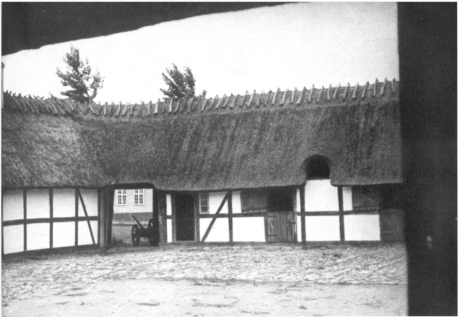
Typischer alter dänischer Bauernhof (sog. Vierkanthof). Blick gegen Einfahrt | Vieille ferme danoise typique | Typical old danish farm yard

und lastend. Dies mag genügen zum Verständnis dänischer Veranlagung, soweit sie in diesem Rahmen von Bedeutung sein kann.