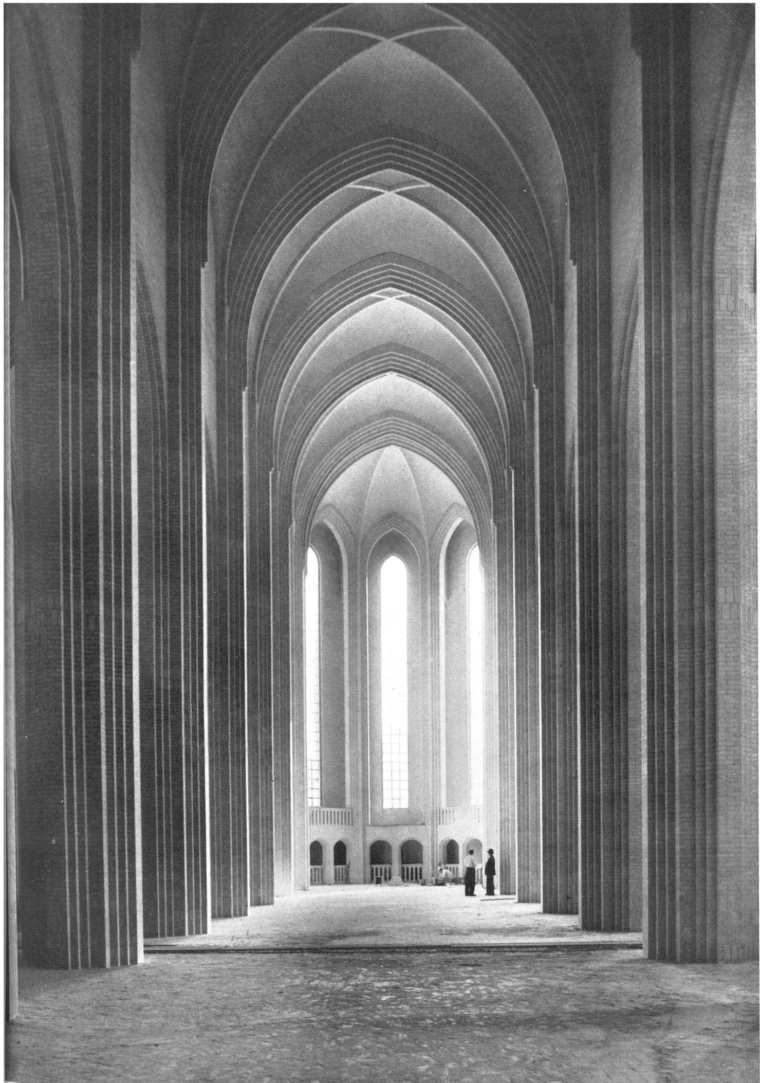
Mittelschiff und Chor der Grundtvigskirche, Kopenhagen. Beispiel eines einheitlichen Backsteinbaus | Eglise de Grundtvig, nef principale et chœur;