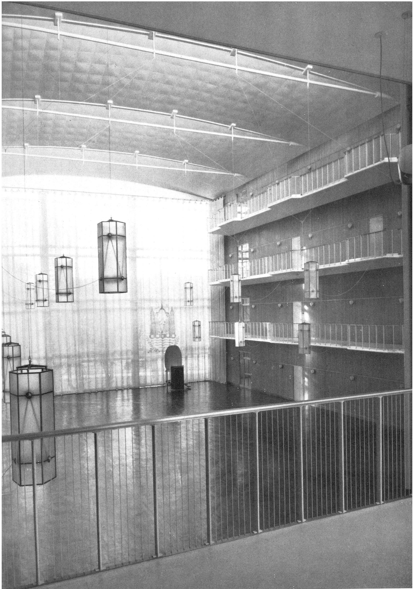
Rathaus in Aarhus, Großer Rathaussaal, Blick von der Verbindungsgalerie im 1. Stock, 1942. Arne Jacobsen und Erik Möller, Architekten M. A. A grande salle de l'Hôtel de Ville de Aarhus, vue de la galerie du premier étage | Main hall of the Aarhus town hall; view from the first floor galley