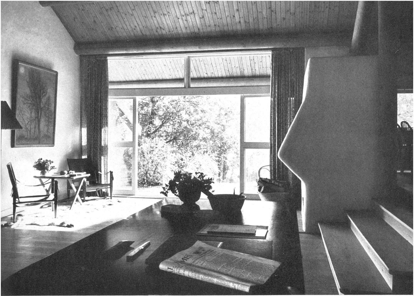
raum mit Kamin, sichtbare Holzdecke / Living-room avec cheminée et toit apparent / Living-room with open fireplace and visible roof-construction