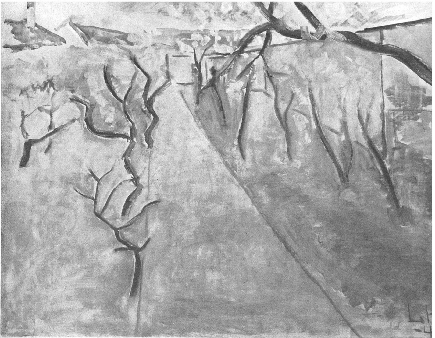
Lauritz Hartz, Garten mit blühenden Obstbäumen , 1944. Kunstmuseum Kopenhagen | Verger en fleurs | Garden with fruit trees in blossom