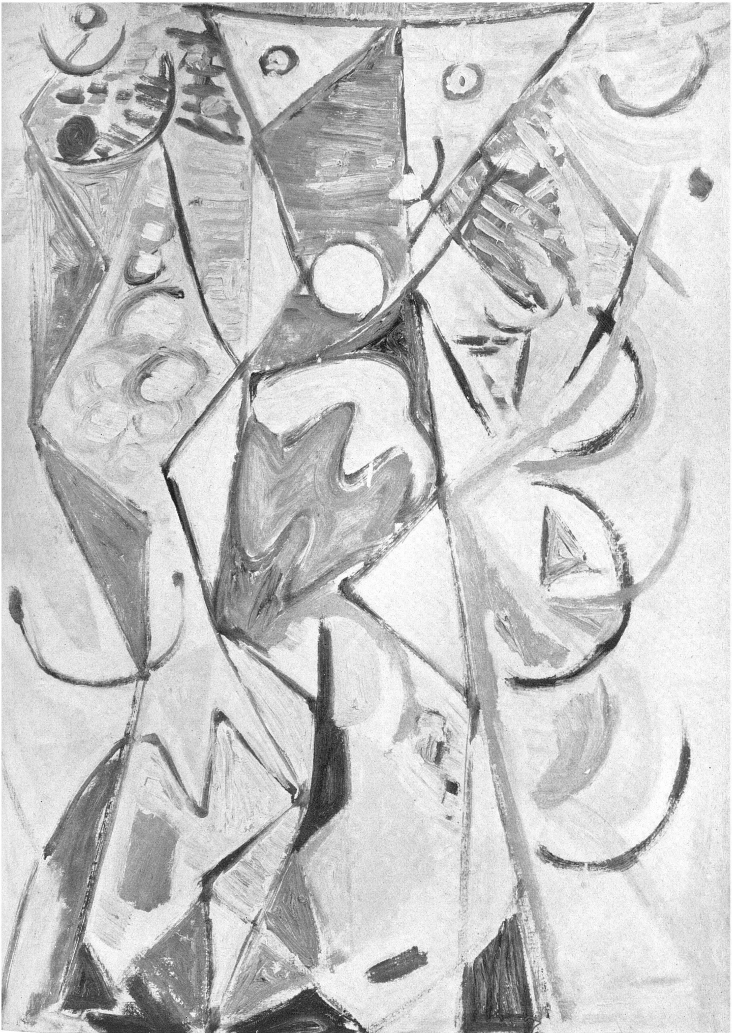
Egill Jacobsen, Blaue Linien, 1947. Kunstmuseum Kopenhagen / Lignes bleues / Blue line.