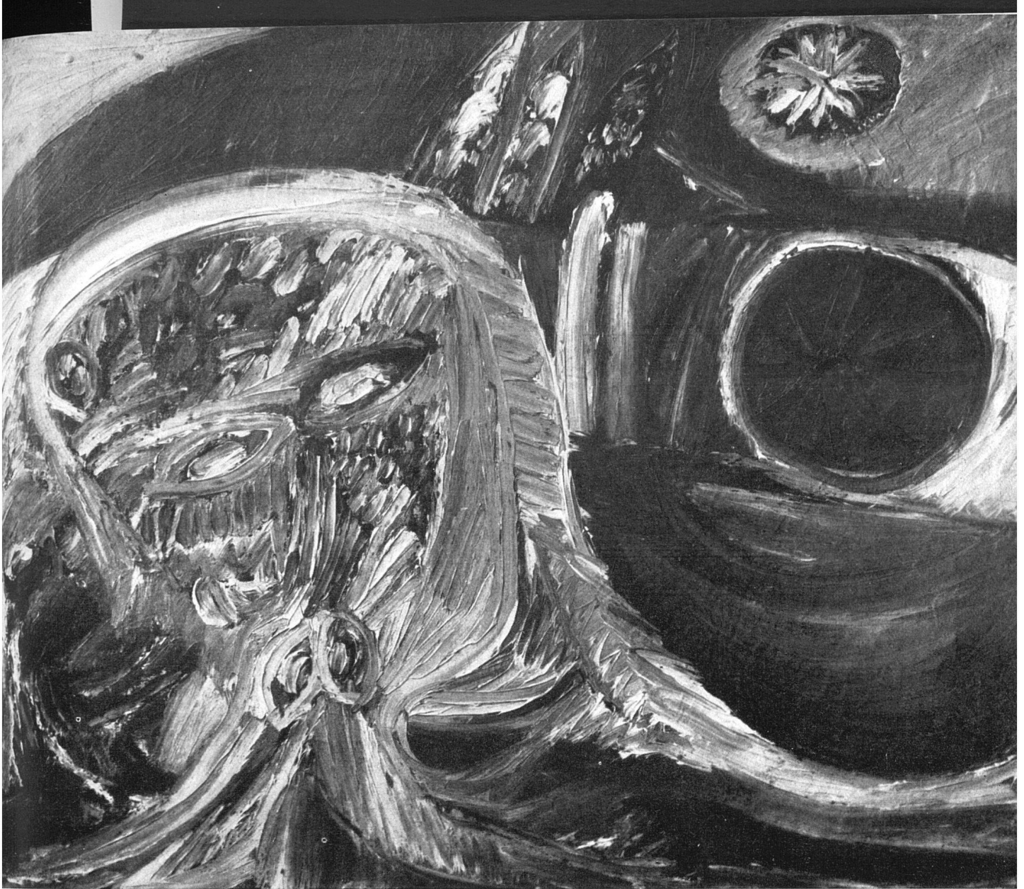
Carl Henning Pedersen, Die Braut , 1947 | La fiancée | The bride

teresse des Künstlers für die formale Gestaltung nicht leugnen läßt, so befaßt er sich mit ihr doch nur in dem Maße, als sie dem Gefühlsausdruck dient. Der Aufbau der Landschaft, in welche der Kopf wie ein Baum hineingestellt ist, ist auch bezeichnend für die farbige Struktur der Bildoberfläche. Sämtliche Farben sind sehr kräftig; die besondere Art des Farbauftrags dürfte von Rubens beeinflusst sein.