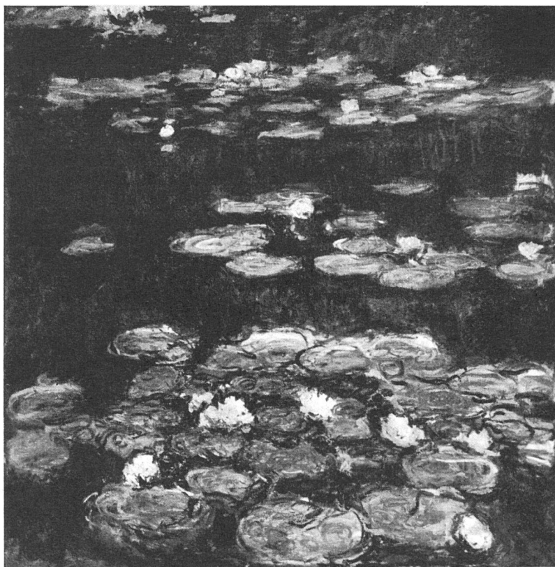
Claude Monet, Les Nymphéas , um 1910. Aus der Impressionisten-Ausstellung in der Kunsthalle Basel

nes Bostoner Museum sei als Besonderheit das Ankaufssystem für zeitgenössische Kunst erwähnt. Abgesehen davon, daß auch für die moderne Abteilung jeder Ankauf von den trustees bewilligt werden muß, kauft das Museum von lebenden Künstlern nur unter der Bedingung, daß das Museum die bereits gekauften Bilder eventuell später gegen bessere oder interessantere umtauschen kann. So kann das Museum unbefangener schon beim jungen Künstler kaufen, weil es die Rückversicherung hat, auf jeden Fall zu seinen stärksten oder reifsten Werken zu kommen. Die Hilfe für den jungen Künstler kann also – ähnlich wie beim Basler Kunstkredit – schon sehr früh einsetzen. Das Bostoner Museum besitzt außerdem die (nach dem Museum von Chicago) zweitgrößte Kunstschule Amerikas, an der – vom Museum aus –, ähnlich wie an unseren Gewerbeschulen, Kunstunterricht erteilt wird. So umfaßt das Museum in Amerika wirklich das gesamte künstlerische Leben – von der Pflege der Kunst der Vergangenheit bis zur Erziehung zum Kunstverständnis und zum Ausüben der Kunst der Gegenwart. m. n.