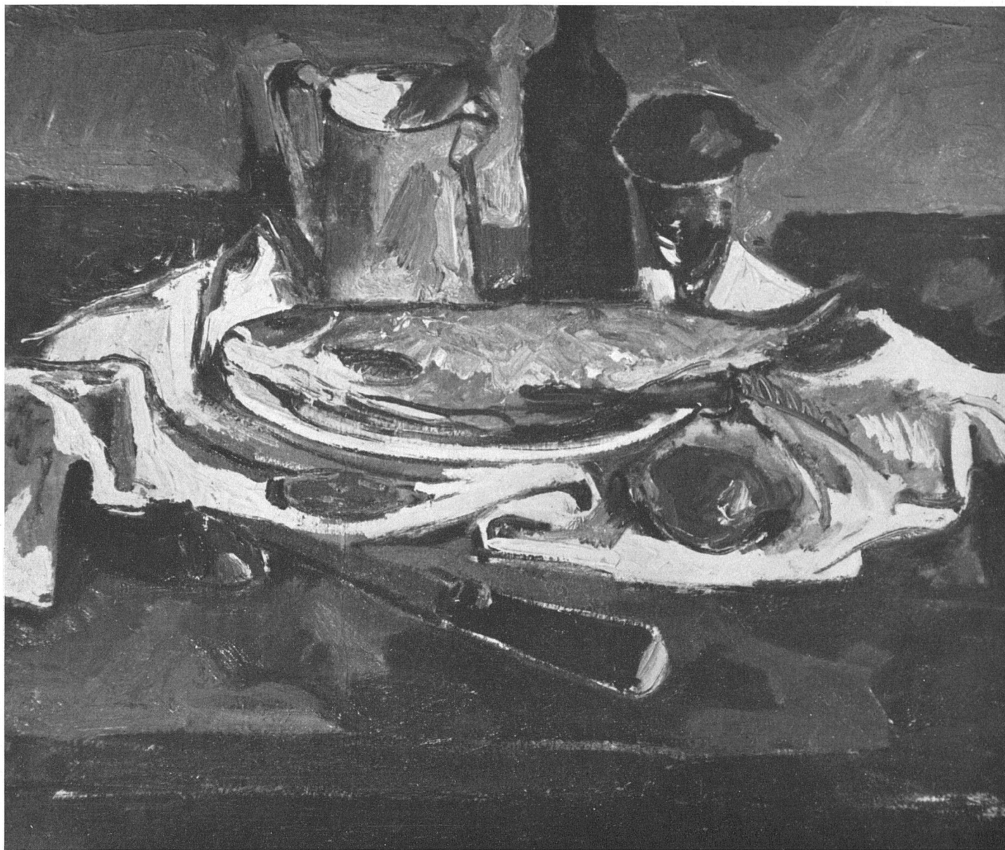
Willy Suter, Nature morte au poisson , 1948 / Stilleben mit Fisch / Fish, still life