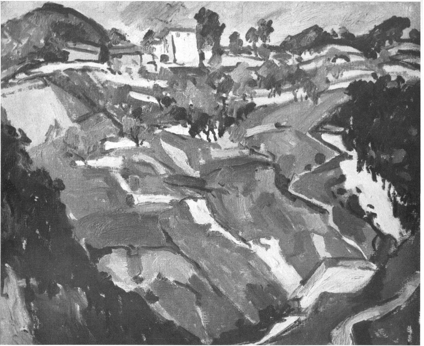
Willy Suter, Paysage de Varazze , 1948 / Landschaft bei Varazze / Varazze Landscape

travail régulier et conduit avec lucidité, et nourrie par un sain appétit de vivre et de chanter la vie: paysages du Genevois et d'Italie, natures mortes de fruits ou de poissons, figures et portraits encore trop rares, à mon gré, dans sa production, tout cela révèle un talent viril, dédaigneux de l'accident et du pittoresque et tout tendu vers ce plan d'expression générale qui, à partir d'un certain degré, est commun à tous les arts.