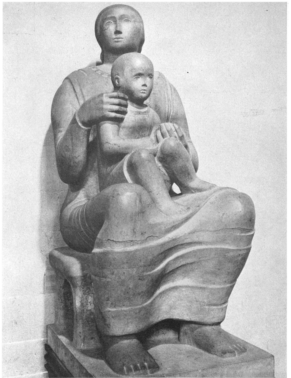
Henry Moore, Madonna und Kind, 1943–1944. Steinplastik in der Matthäuskirche in Northampton / La Vierge et l'Enfant, pierre. Eglise Saint-Mathieu, Northampton / Madonna and Child. Hornton stone, Saint Matthew's Church, Northampton