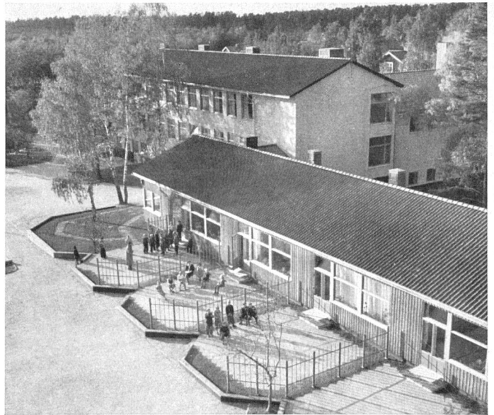
Das gestufte Schulhaus steht heute auch in Schweden zur Diskussion, 1941/42, Volksschule in Västerås, Sven Ahlbom, Arch. SAR | Les architectes suédois discutent actuellement de l'abolition des grandes écoles et réclament une conception plus différenciée | The schools in Sweden are in general too big; a more differentiated conception is actually wanted

Schweden kann aus dem Bewußtsein des bisher Erreichten und dank seiner Besonnenheit, seiner gesunden menschlichen und sozialen Natur die gewissen Unsicherheiten der gegenwärtigen Lage seiner Architektur ohne weiteres überwinden und wird damit auch einen äußerst wertvollen Beitrag zur Klärung der allgemeinen Lage leisten.