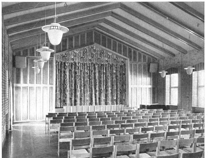
Gemeinschaftszentren gehören heute zu den aktuellsten Baufragen. Theatersaal im Volksheim der L. M. Ericsson Telefonfabriken, Stockholm, 1947. T. Wennerholm, Arch. SAR | Les bâtiments sociaux comptent aujourd'hui parmi les questions les plus actuelles. Salle de réunion d'un foyer ouvrier | Community centers are of great actuality. Assembly room of a welfare worker's center