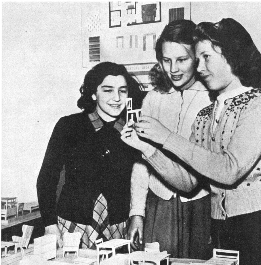
In Schweden gehört das Studium des Wohnproblems zum Unterricht an Haushaltungsschulen. Es ist geplant, damit schon in der Volksschule zu beginnen / En Suède les problèmes de l'habitation font partie de l'enseignement aux écoles ménagères, mais on veut également les mettre au programme des écoles normales / In Sweden domestic science includes the study of housing problems, which will also be a subject in secondary schools in future