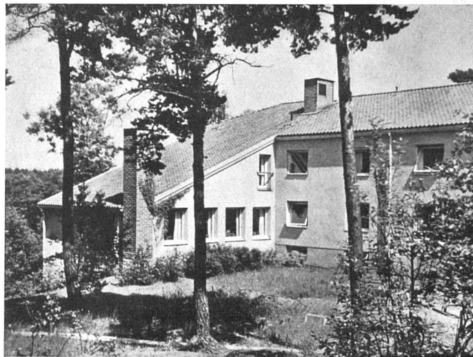
Heim für junge unverheiratete Arbeiter der Gustavsberg-Fabriken AG. 1943, Kooperativa Förbundets Arkitektkontor, Stockholm | Dortoir pour jeunes ouvriers célibataires | Dormitory for young unmarried workers

Eine in dieser Weise gegliederte Ausstellung würde gegenüber einer solchen von herkömmlicher Art nicht mehr nur zu bloßer beschaulicher Begegnung einladen, sondern zu fruchtbarer vertiefter Auseinandersetzung