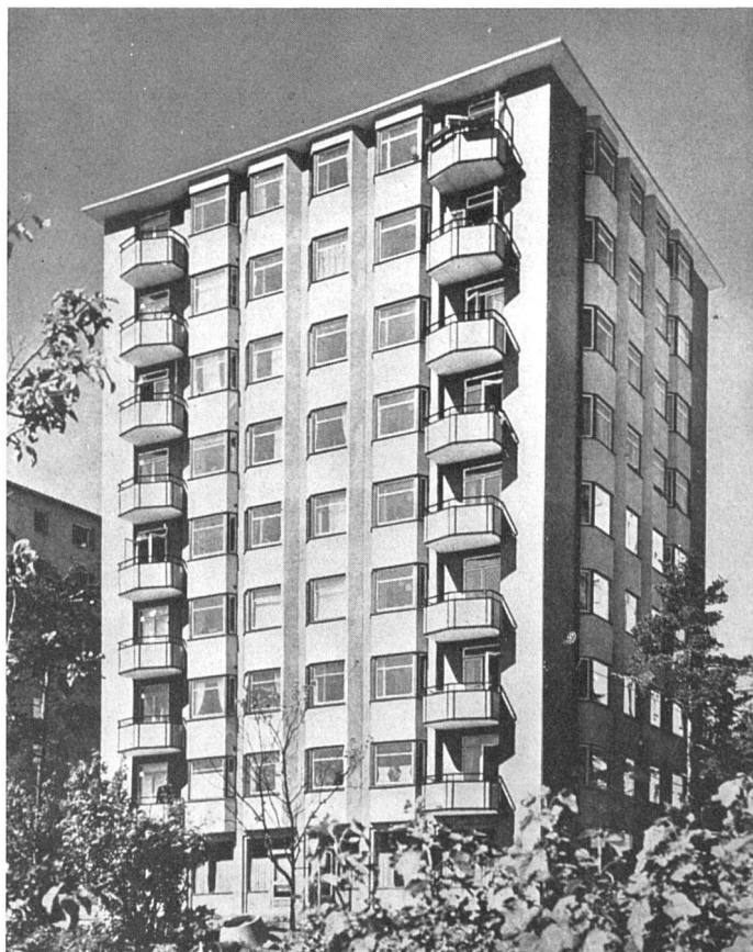
Punkthaus in Stockholm 1947, C. A. Acking & S. Hesselgren, Arch. SAR | Immeuble-tour | Tower house