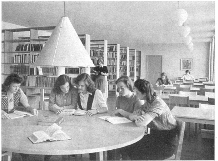
Die Gemeinschaftsräume der schwedischen Schulen sind sehr wohnlich und gut ausgestattet. Bibliothek einer höheren Mädchenschule Stockholms, 1945, N. Ahlbom & H. Zimdahl, Arch. SAR | Bibliothèque d'une école de jeunes filles; installation intime et confortable | Reading room in a girl's school with carefully designed equipment