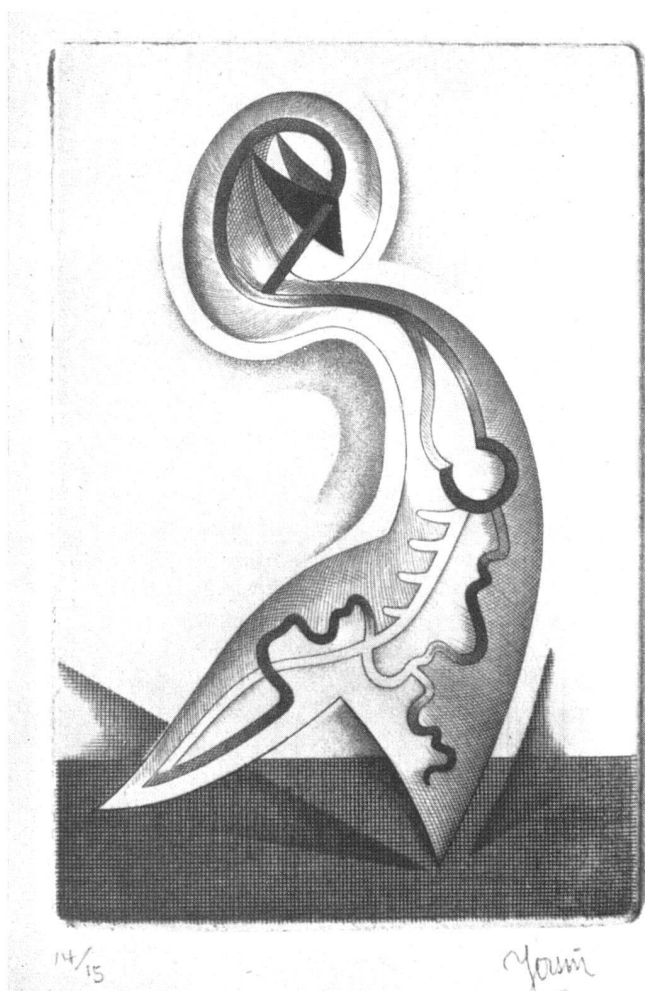
Yersin, Abstraction II ; gravure au burin | Abstraktion II , Kupferstich | Abstraction II , engraving

soin s'en fait sentir, comme le philosophe crée des mots nouveaux ou leur attribue une acception inusitée pour serrer de plus près sa pensée, Flocon poursuit ses recherches avec la sagacité et la patience d'un physicien. Cela donne ces formules abstraites comme celles qui constituent la série de planches consacrées à la «Matière» ou ces peintures dans la plus pure tradition surréaliste que sont «L'Arbre», «La Tour», «L'Oignon» ou «Désintégration», et dans lesquelles l'imagination utilisant les associations d'idées conduit vers la synthèse et, plutôt que la glorification de l'objet accidentel, la définition de l'essence même de cet objet, et enfin vers les buts plus lointains de l'artiste qui rêve en somme d'une sorte de réalisme métaphysique.