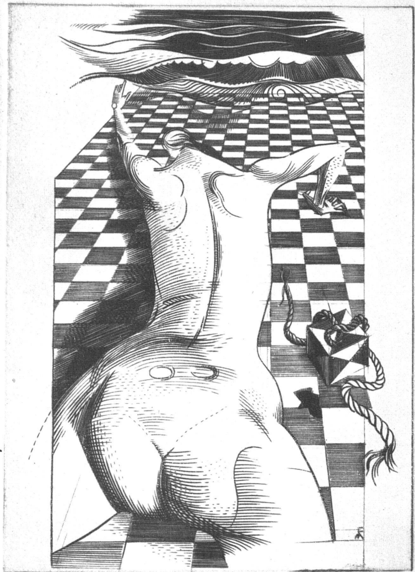
Flocon, Gravure au burin de la suite «Paysage» | Kupferstich aus der Serie «Paysage» | Engraving from the series «Paysage»

indications sur leurs ambitions et l'orientation de leurs travaux. «Nous vous montrons», écrivent-ils, «les résultats provisoires de recherches sur lesquelles nous voudrions donner quelques explications. La peinture et tout ce qui s'y rattache sur le plan d'une création à deux dimensions, représente pour nous moins un sujet de délectation qu'un moyen de connaissance. Un moyen de connaissance qui, dans une certaine mesure où il est efficace, conduit nécessairement à la connaissance des moyens. Et l'utilisation des moyens nous ouvre en fin de compte des vues tant en nous-même que sur le monde extérieur. Dans ce sens ne pourrait-on voir dans l'art et dans la science deux démarches de l'esprit vers le même but?»