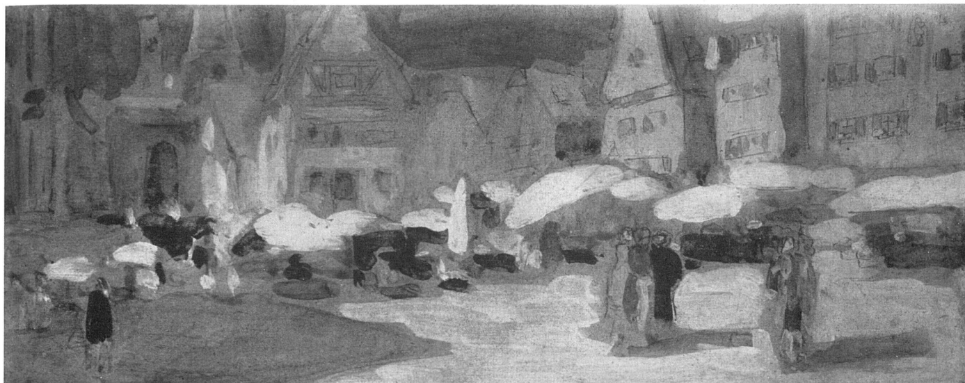
Wassily Kandinsky, Marktplatz , 1900, Tempera . Sammlung N. Kandinsky, Paris | Marché. Détrempe / Market-place. Distemper