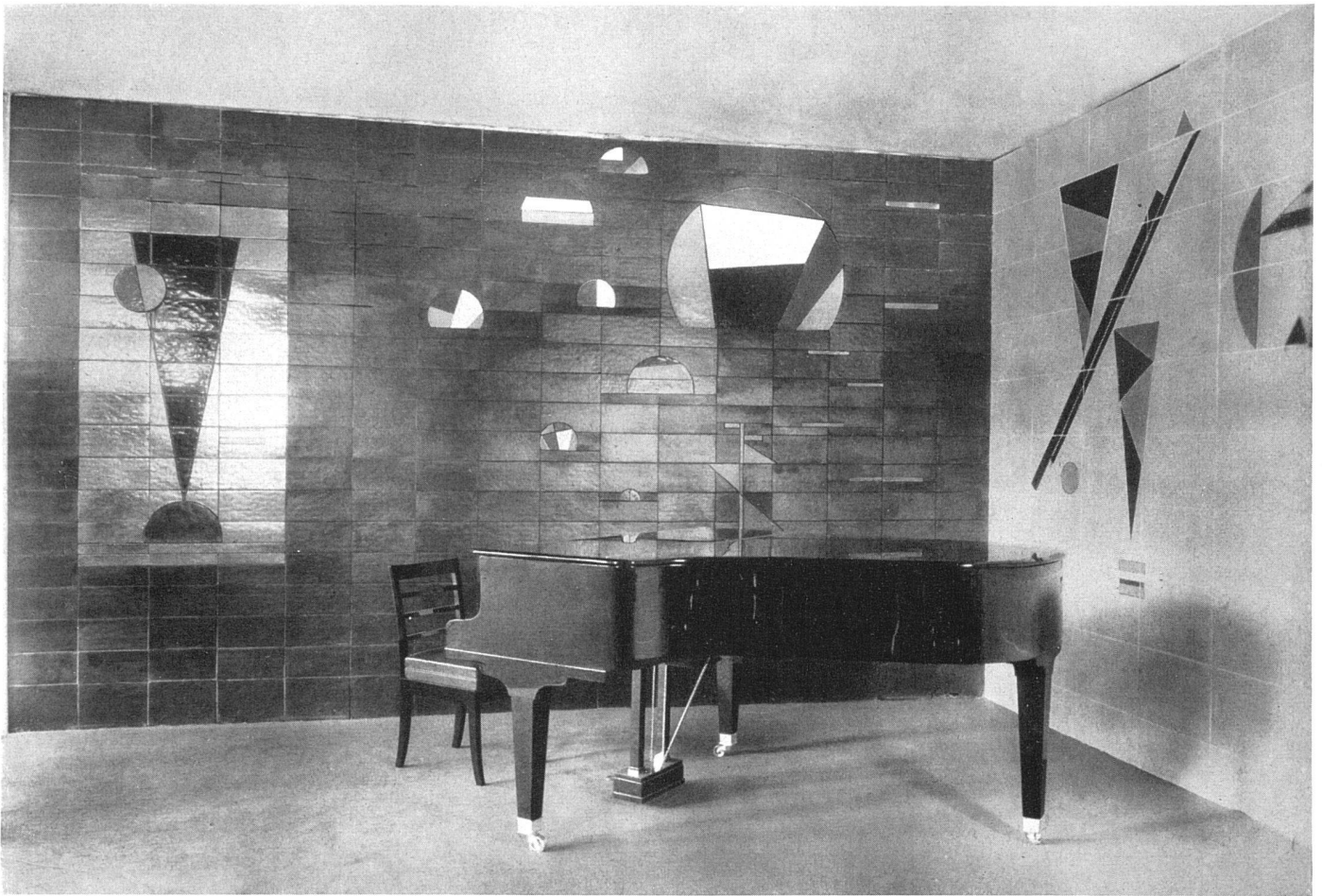
Wassily Kandinsky, Wandmalerei im Musiksaal der Internationalen Architekturausstellung, Berlin 1931 | Peinture murale; Salle de Musique de l'Exposition internationale d'Architecture, Berlin 1931 | Mural painting in the Music-Room of the International Exhibition of Architecture, Berlin 1931

eine im Dampf stehende Gestalt als «weder nah, noch weit», sondern als «irgendwo» im Unmeßbaren erlebte, als Offenbarung dieses neuen räumlichen Universalismus.