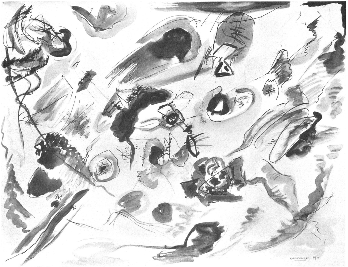
Wassily Kandinsky, Erstes abstraktes Aquarell , 1910. Sammlung N. Kandinsky, Paris | Première aquarelle abstraite | First abstract water-colour

Kandinsky, von der universal-psychischen Seite her an die Umwälzung des Optischen, sondern im Sinne eines physikalisch erweiterten, nie dagewesenen – und dadurch vielleicht auch mystisch sich auswirkenden – Weltbildes heran. Man formte dingliche Realität zum Baustein einer Synthese der raum-zeitlichen Existenz um. Der Kubist malte «wissend» und «gesetzmäßig» seine Formsymbole; auch er war nicht mehr naturbeobachtend auf einen zufälligen Gegenstand hin gerichtet. Wie Apollinaire, der Wortführer des Kubismus, damals schrieb, war es «la réalité de connaissance», womit man das Objekt neu zu erfassen suchte. Aber dieser Gegenstand lebte im Kunstwerk dennoch weiter, wenn auch nur als Ausgangspunkt, wenn auch nur als Schatten seiner selbst. Er hatte ein vergeistigtes, vielfältiges Leben erhalten, spiegelte und spaltete sich, um endgültig von einem großen «lyrischen» Kaleidoskop aufgesogen zu werden, wie die Vokabel in den kristallinisch komprimierten Gedichten Mallarmés. Auch hier etwas völlig Neues: Gleichnis anstatt Illusion, und damit Spiritualisierung, wenn auch nicht mit der letzten Konsequenz und Universalität wie bei Kandinsky. Die kubi-