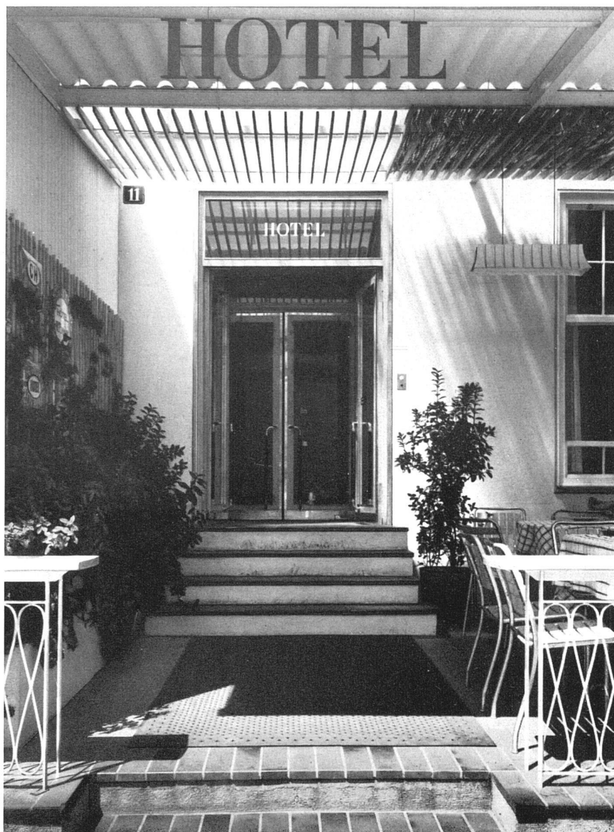
Hoteleingang | Transformation de l'hôtel «Jura» à Bâle. Entrée | Renovation Hotel «Jura», Basle. Entrance