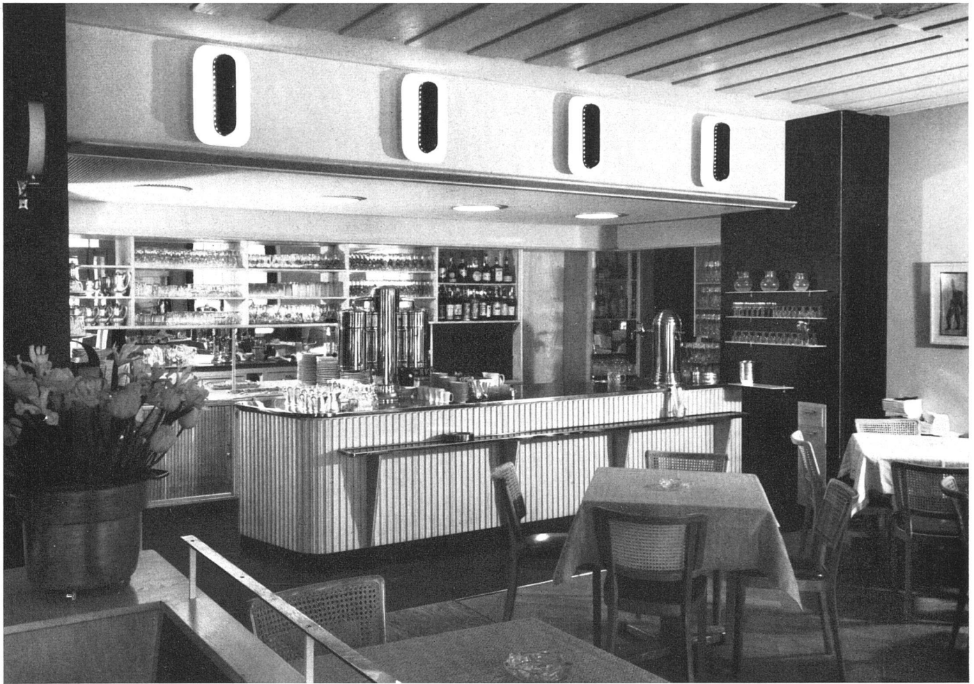
Buffetanlage | Le buffet | The bar