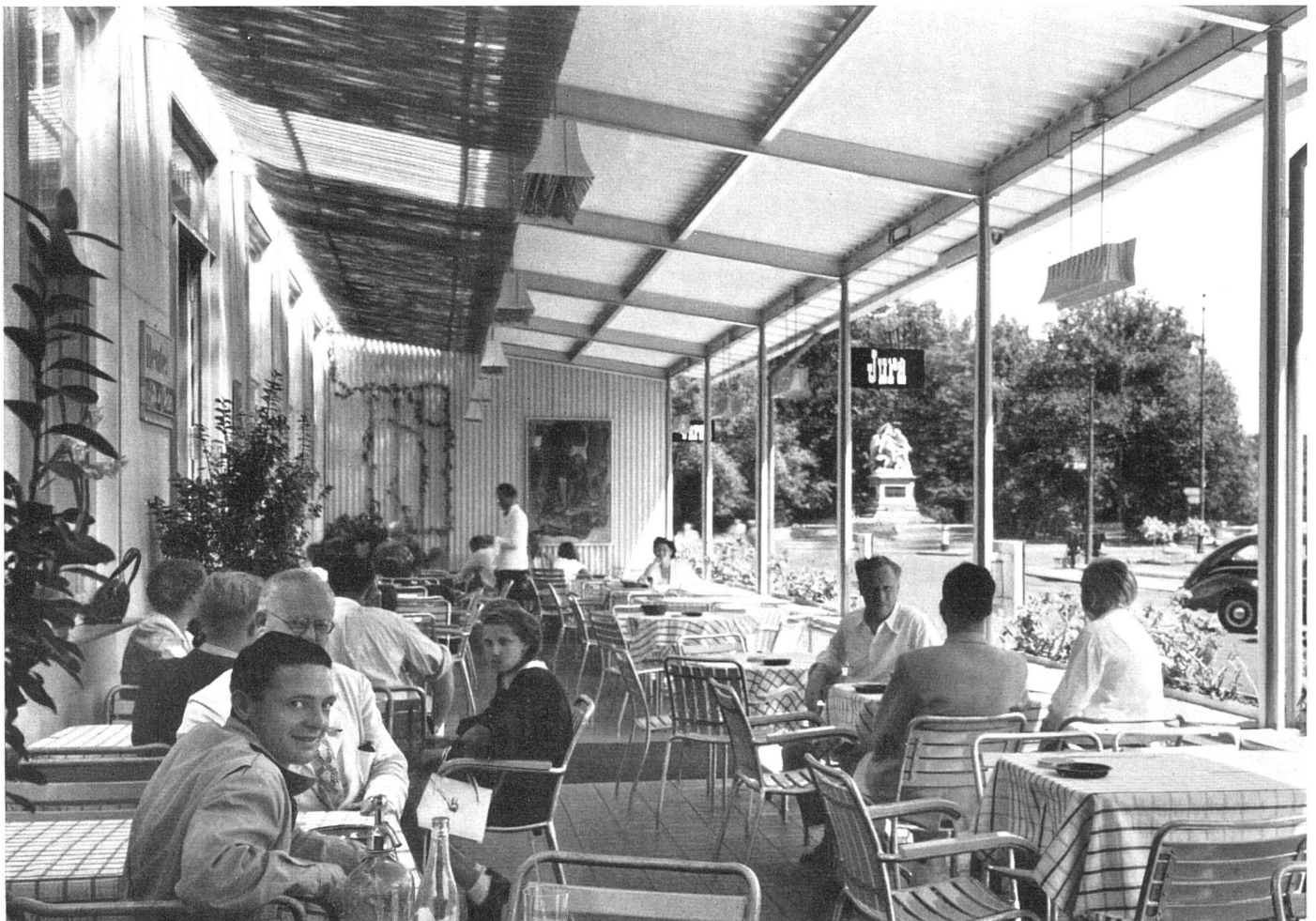
Terrassenrestaurant, mit Welleternit abgedeckt | Restaurant-terrasse, couverture en éternite ondulée | Terrace-restaurant with wave-eternit

Der Besitzer, als bekannter Kunstfreund und Werkbündler, hatte schon immer darauf gehalten, an den Wänden Bilder lebender Künstler aufzuhängen. Es lag für den Architekten darum nahe, diese selten günstige Voraussetzung zu nützen. Ein in kostbaren Farben leuchtender Rouault, ein Braque, an den Querwänden zwei Bilder von Coghuf, Originale von Hodler, Berger, Cingria und anderen Künstlern stehen nun auf den weißen Wänden. In den Nischen sind Wechselrahmen angeordnet, in welchen nun die schöne Sammlung von Lithos, Holzschnitten usw. ausgestellt wer-