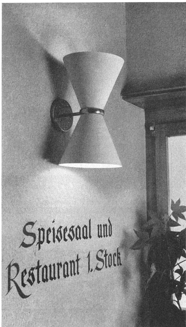
Restaurant Löwen, Kloten