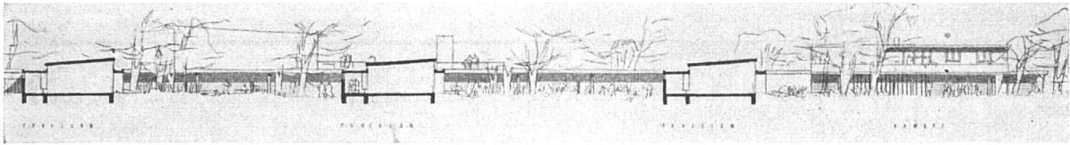
Wettbewerb für ein Realschulhaus in Münchenstein. 1. Preis: W. Wurster und H.-U. Huggel, Architekten, Basel/Paris. Schnitt durch die Klassenpavillons, die Querlüftung und doppelseitige Belichtung besitzen. Der sehr erfreuliche Entwurf zeichnet sich durch richtige Anwendung der Idee der Pavillenschule und reizvolle Anordnung der kollektiven Räume aus

wurfes mit der weiteren Planbearbeitung zu beauftragen. Preisgericht: M. Häni, Notar, Interlaken (Vorsitzender); Walter Gloor, Arch. BSA, Bern; Hermann Rüfenacht, Arch. BSA, Bern.