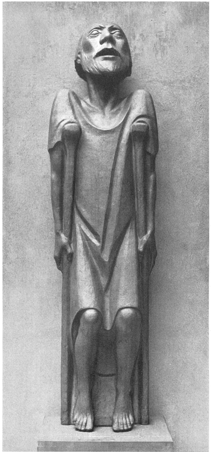
Ernst Barlach, Bettler; Fassadenfigur an der Katharinenkirche, Lübeck. Klinker, 1930 | Mendiant. Brique hollandaise | Beggar. Clinker