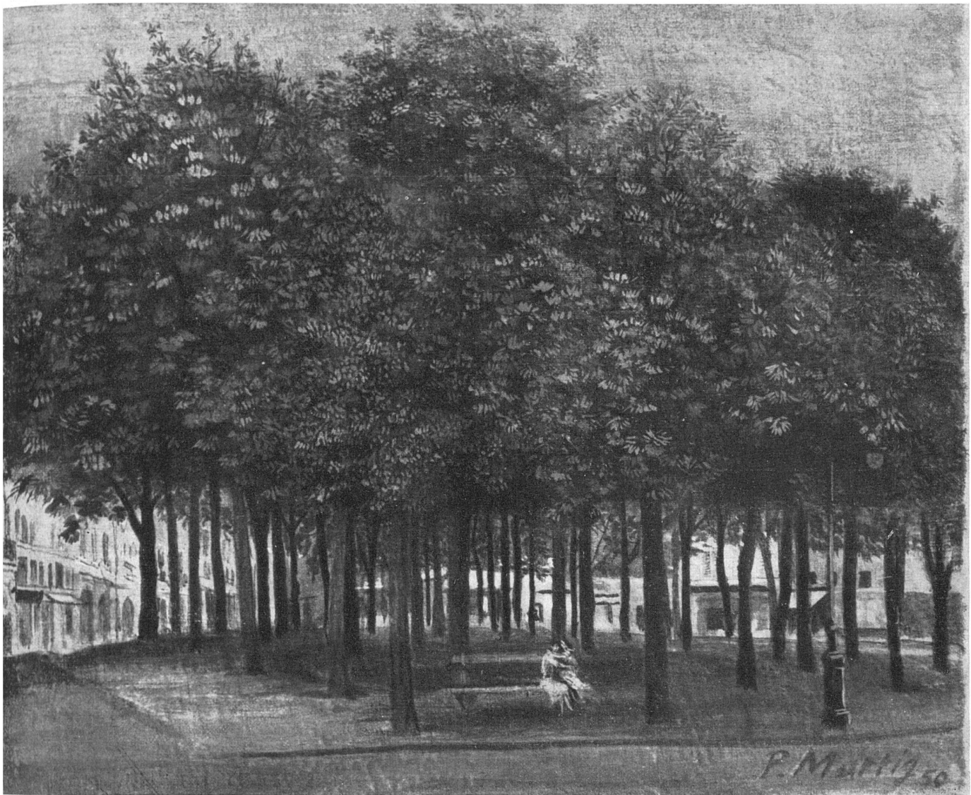
Paul Martig, Die Place Dauphine, Paris, 1950 | La place Dauphine | The Dauphine Place, Paris