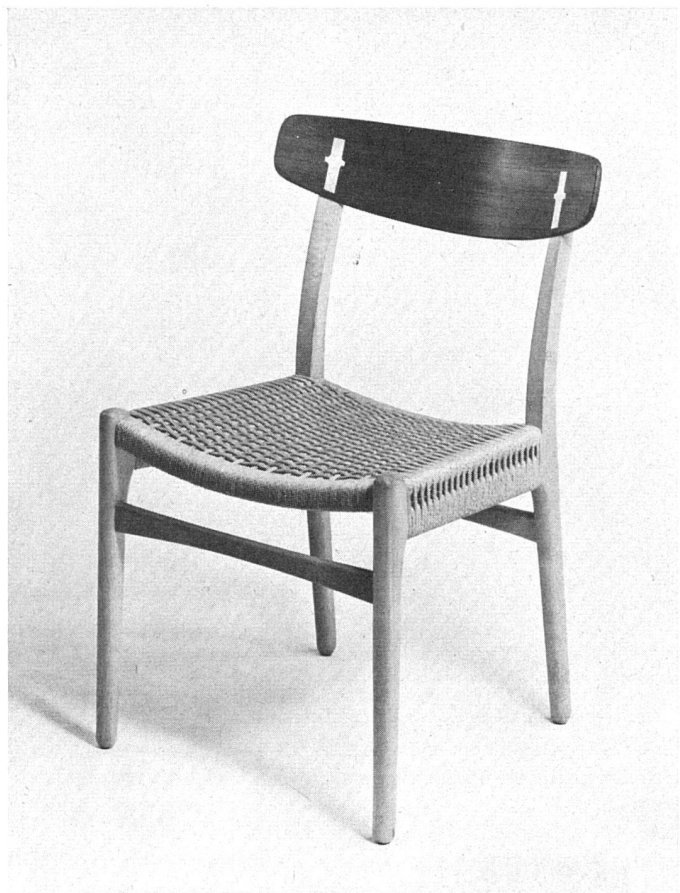
Eßzimmerstuhl. Rückenlehne Teakholz, Rahmen Buche, Sitz aus Papierschnurgeflecht. Entwurf H. J. Wegner, Ausführung C. Hansen & Sohn, Odensee | Chaise de salle à manger | Diningroom chair, back of teak, frame of beech, seat of paper cords