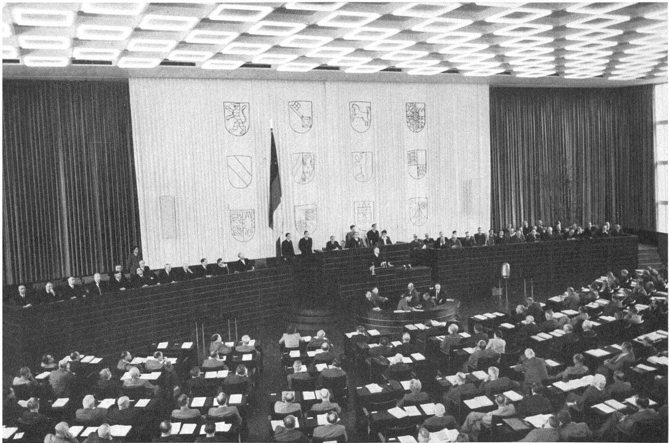
arsaal, 850 Sitzplätze. Bundeskanzler Dr. Adenauer stellt sein Kabinett dem Bundestag vor (20. 9. 1949). Vorhang mit den 12 Länderwappen in aus weißem Velours. Schwingstühle und Pulte schwarz, Polster grünes Leder | Salle des séances du Parlement | The parliament hall, Chancellor Adenauer presenting his cabinet (20. 9. 1949)