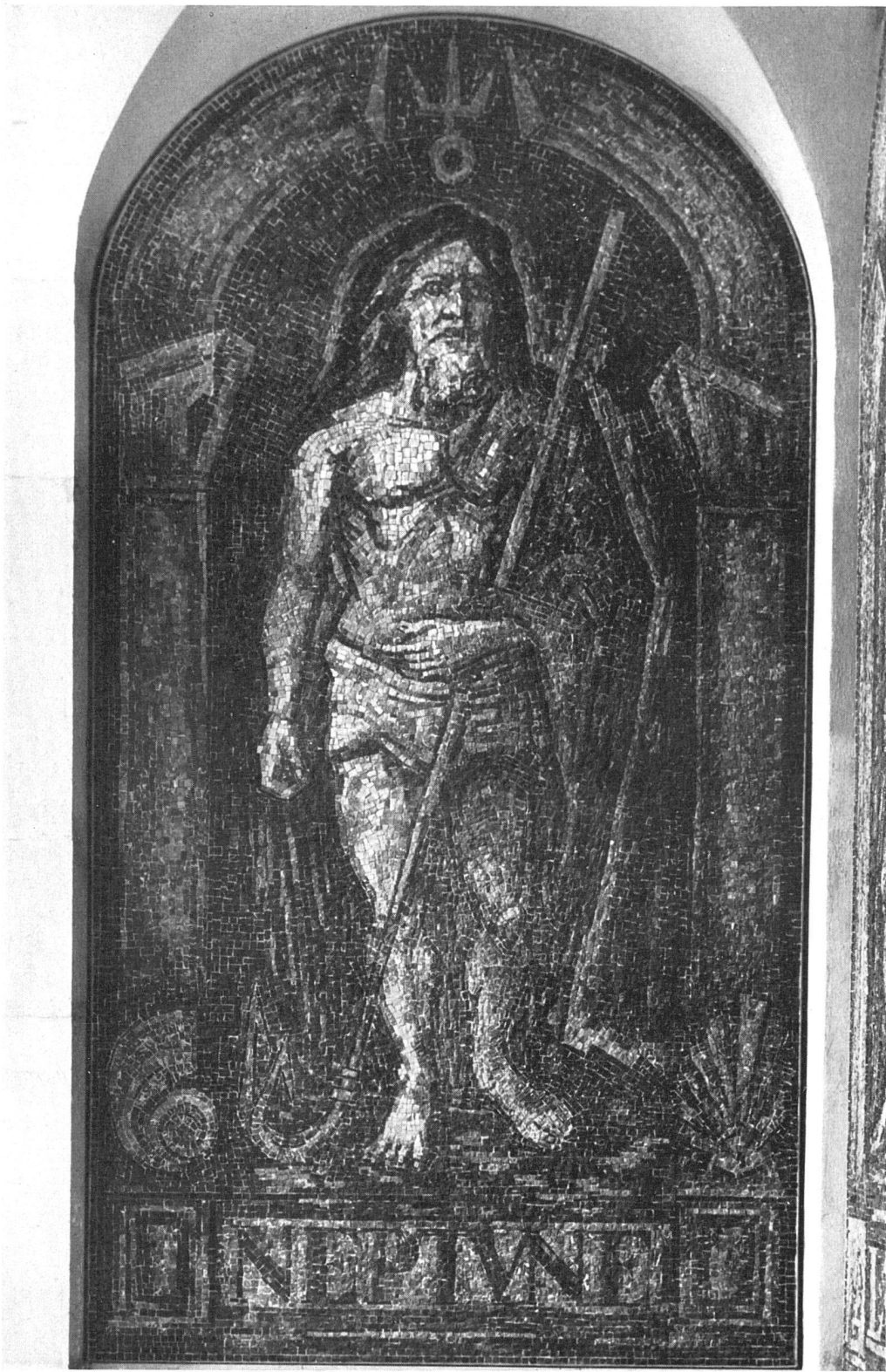
Neptune | Neptun | Neptune