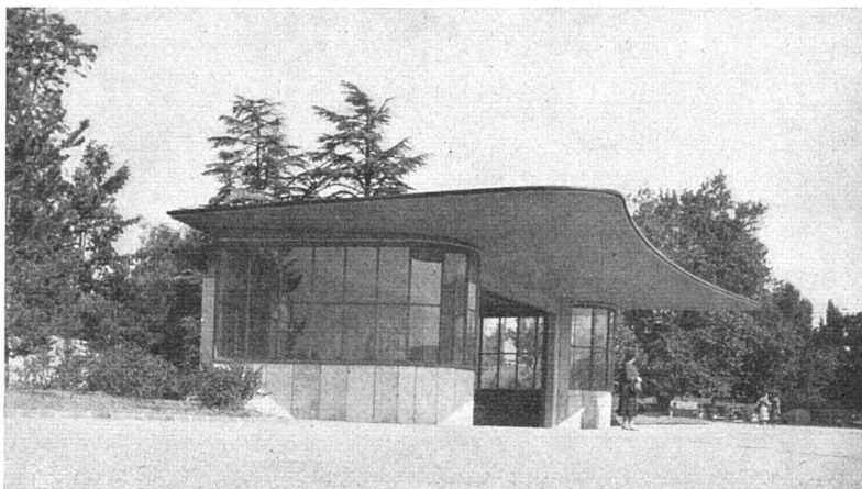
Wartehalle Place des Nations, Genf. 1949, Francis Quétant, Arch. BSA, P. Honegger, Ing. E. I. L., Genf

Diese Wartehalle dient den Autobuspassagieren des UNO-Gebäudes und der Nachbargebiete. Die Halle ist gegen die West- und Nordwinde verglast und weist außer Sitzbänken zwei Telephonkabinen, Briefkasten und zwei Aborte auf. Konstruktion: behauener Eisenbeton, Dachplatte auf drei Stützpunkten ruhend mit Versteifungsrippen. Verkleidung der Fensterbrüstungen mit hellgrünen Quarzitplatten von St. Nicolas (Wallis). Schreinerarbeiten aus Eichenholz. Neonbeleuchtung.