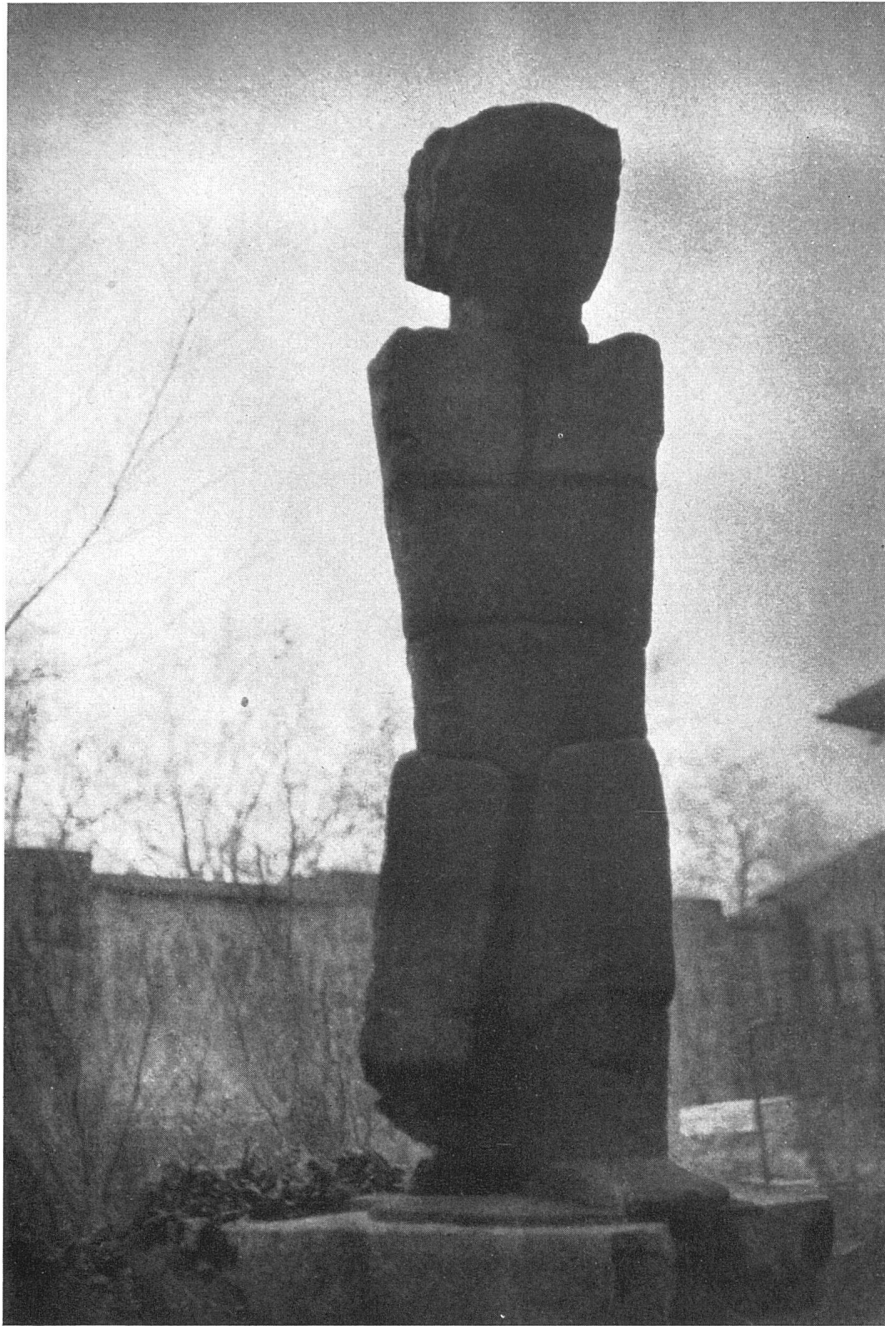
Fritz Wotruba, Stehender. Bronze, 1951/52 | Figure debout. Bronze | Figure erect, bronze