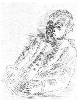
Raoul Dufy, Ambroise Vollard. Radierung, um 1930

tracé sur la pierre un sillage qui s'enroule en arabesques sensuelles, ou de larges signes qui s'étendent en taches bondissantes. Devant ces estampes tirées en noir, exceptionnellement en bleu, on se laissait porter sur la mer mouvante et noire chapeauté de cargos fumants, on suivait de l'œil l'évolution des voiliers, l'animation du port du Havre, ses bateaux-pilotes affairés marqués en pleine voile de leur gros monogramme. On comparait les deux versions, la grande et la petite des «Six Baigneuses», on saluait le portrait d'Othon Friesz, ou celui, en pied et en couleurs sorti tout droit du panneau de l'électricité, d'Ampère. Dans une «affiche avant la lettre», sous les verts nuancés, et dans un embrasement d'une curieuse ampleur, c'était tout le lyrisme végétal d'un été flamboyant. Dufy, d'ailleurs, quel bel affichiste! Il le prouvait dans ces avis d'exposition que déjà l'on se disputait, qui annonçaient Cinquante ans de peinture française, le Fauvisme, et les expositions chez Carré ou au Musée d'Art Moderne. Les drapeaux du 14 juillet en 1907, les fanfares militaires, que ces évocations fissent resplendir la symphonie des trois couleurs ou recherchent plus discrètement les effets de transparence d'une dominante, étaient chaque fois une fête pour l'œil.