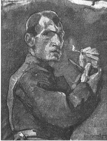
Numa Donzé, Selbstbildnis 1917. Kunstmuseum Basel

Pariser Aufenthalt 1907 herum entstand) von der Vorherrschaft des Böcklinschen Idealismus und Klassizismus. Schon während eines römischen Aufenthaltes, 1905, hat Donzé in großen pastos und tonig gemalten Flächen einen Ausschnitt der «Dächer in Rom» gemalt, großartig und kraftvoll und außerdem noch in der Art jenes realistischen Courbet, den die Künstlerfreunde dann wenig später als Pariser Eroberung mit nach Basel bringen sollten. Das Frühwerk Donzés, die ersten Rheinlandschaften um 1908, die Olivenhaine der Provence, gehen über den Courbetschen Realismus schon weit hinaus. Man spürt die eigene Verarbeitung Van Goghs, da und dort auch Hodlers, im Sinne einer modernen, flächen- und linear-expressiven Malerei. In den Fresken an dem Bau der alten National-Zeitung am Marktplatz (der kürzlich abgerissen wurde) hat diese schöne künstlerische Entwicklung einen Kulminationspunkt erreicht. Donzé hat später nie mehr so groß gesehen, einheitlich und streng gemalt. m. n.