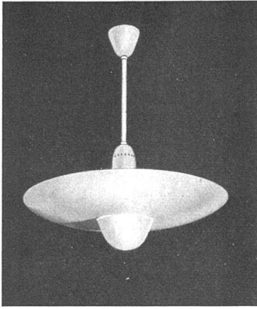
Oben: Indirektleuchte der Firma Karl Gysin & Co., Basel