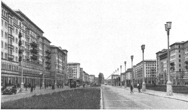
Straßenbild der Stalin-Allee (ehemals Frankfurter Allee)