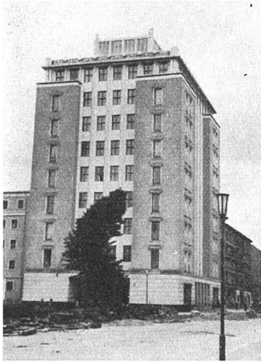
Wohnbau für «Verdiente Arbeiter» 1952/53

Unsere Bilder zeigen, wie diese Repräsentationsbauten der Ostzone den gleichen Stil- und Monumentaltendenzen huldigen wie die Staatsarchitektur in Moskau oder Warschau.