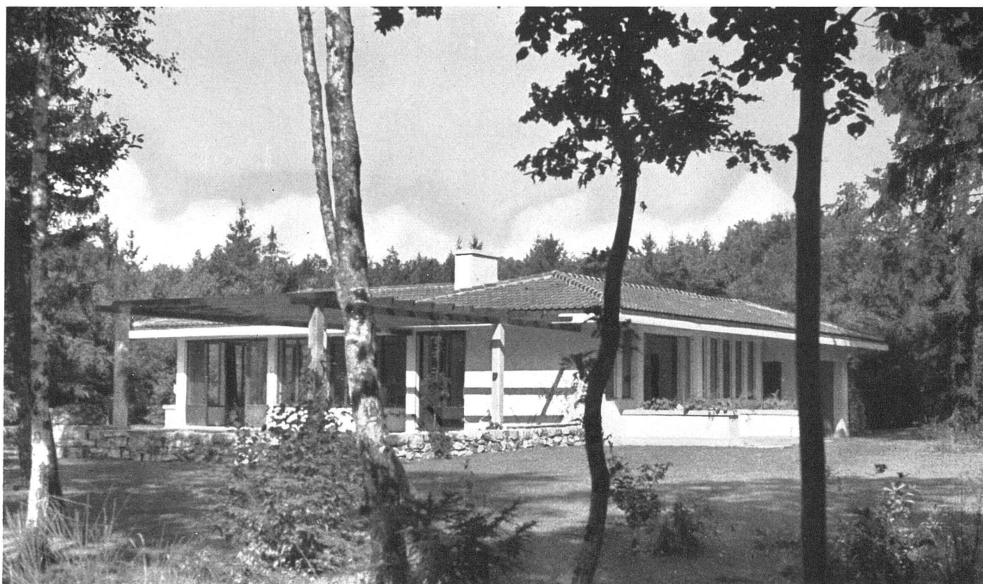
Gesamtansicht von Osten | Vue prise de l'est | From the east