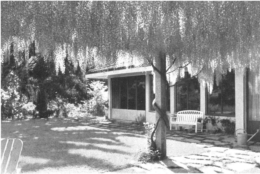
Blick auf den Wohnraum von der Pergola aus | Coin du jardin et pergola couverte de «Wisteria multijuga van Houtte» | Towards the living room